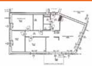
Kammermayrstraße 6, Top 7