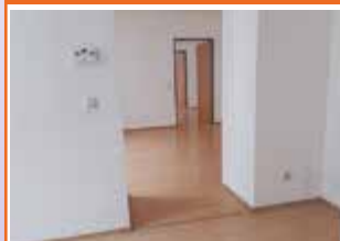
Direktionsstraße 4, Top 3