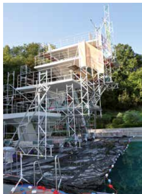
Der Sprungturm beim Sportbecken wurde aufwändig saniert. Das dafür notwendige Gerüst ragte über den Beckenrand hinaus.