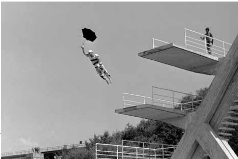
Akrobatischer Sprung vom 10-Meter-Turm bei der Eröffnung des Steyrer Freibades am 20. Juni 1959

Im Gemeinderat herrschte Hochspannung und in der Bevölkerung brodelte die Gerücheküche. Nur mit Mühe und nicht ohne kräftigen politischen Gegenwind gelang es Bürgermeister Fellingner, die 15 Millionen Schilling freizumachen, die das Projekt im Endeffekt verschlang. Doch über all den vorangegangenen Hindernissen standen, ohne irgendeinen äußeren Makel, die Schönheit und die perfekte Funktionalität von Grünbergers Werk.