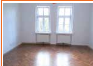
Damberggasse 31, Top 1