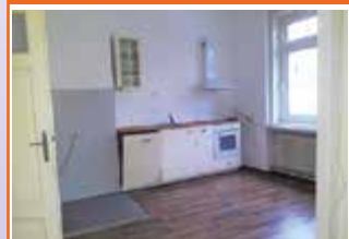
Dukartstraße 7, Top 4