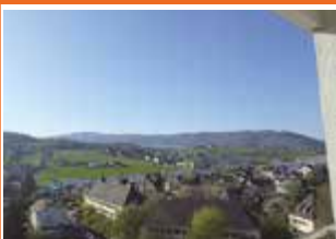
Kammermayrstraße 13, G30