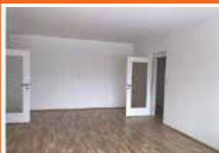
Kammermayrstraße 11, Top 5