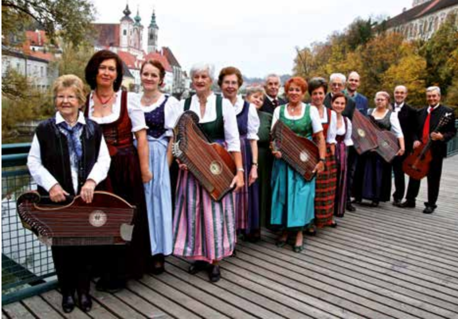
Der Steyrer Zitherverein lädt am 27. April zum Festkonzert anlässlich seines 90-jährigen Jubiläums ins Stadttheater ein.