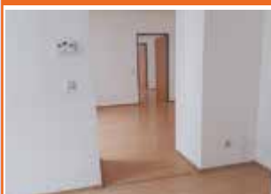
Direktionsstraße 4, Top 3