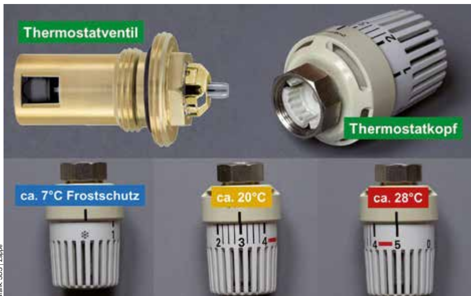
Ein Heizkörper-Thermostatventil sorgt für die automatische Einhaltung der eingestellten Raumtemperatur und hilft, Energie zu sparen.

Heizkörper-Thermostate „mit Voreinstellung“ bieten die Möglichkeit der Einregulierung des Heizwassernetzes durch einen Heizungsprofi. Das trägt zusätzlich zur optimalen Wärmeabgabe der Heizkörper und somit zur Energie-Einsparung bei. Fragen Sie dazu Ihren Installateur.