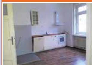
Dukartstraße 7, Top 4