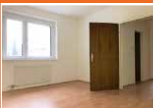
Kammermayrstraße 5, Top 5