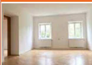
Damberggasse 32, Top 21