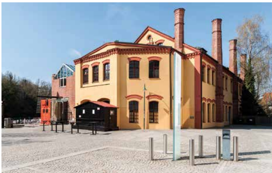
Ein Haus mit Geschichte: Das Museum Arbeitswelt feiert sein 30-jähriges Jubiläum mit einem Festakt am 28. April.