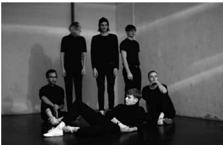
Die Steyrer Band Catastrophe & Cure besucht am 6. Mai das Röda auf ihrer „Blank Spots Release Tour“. Konzertbeginn ist um 21 Uhr.

Die „Brennesseln“ ziehen nach 35 Jahren und 35 Programmen Bilanz über ihre zersetzende Tätigkeit und bringen die treffendsten und besten Nummern ihres langen Wirkens. Alle diese Sketche, Lieder und Dialoge kommen aber so zeitlos und aktuell daher, dass man ihnen das Alter nicht anmerkt und gerade dies erschreckt eigentlich. Denn es bedeutet, dass viele der Probleme auch weiterhin einer Lösung bedürfen.