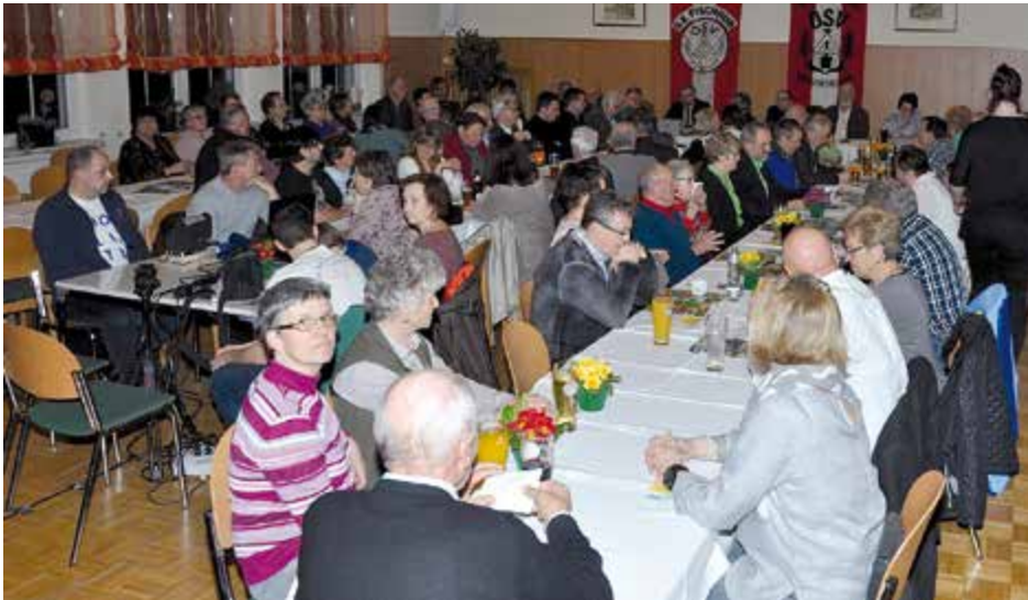
Vor kurzem feierte der Siedlerverein Fischhub sein 80-jähriges Jubiläum mit einem großen Fest. Zahlreiche Mitglieder, Siedlerfreunde und Ehrengäste folgten der Einladung.

Die Vereinsmitglieder profitieren von Einkaufsvorteilen bei vielen ansässigen Firmen, angeboten werden auch Vorträge, Baumschnittkurse und Gartenfachberatungen, auch verschiedene Gartengeräte können ausgeliehen werden.