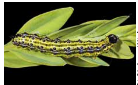
Die Raupen des Buchsbaumzünslers fressen die Blätter und dann die grüne Zweigrinde des Buchsbaums. Bei starkem Fraß können ganze Pflanzen absterben.

Die Entsorgung über die Grün- und Strauchschnitt-Sammlung (Grünschnitt-Container) ist nicht geeignet , da sich der Buchsbaumzünsler dort weiterhin ausbreiten kann.