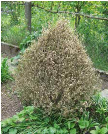
Der Buchsbaumstrauch ist nach dem Befall abgestorben. Die richtige Entsorgung ist wichtig, damit sich der Buchsbaumzünsler nicht weiter ausbreiten kann.

Der Buchsbaumzünsler ist ein ostasiatischer Kleinschmetterling, die Raupen fressen zunächst die Blätter des Buchsbaums, dann die grüne Zweigrinde. Bei starkem Fraß können einzelne Triebe oder sogar ganze Pflanzen absterben.