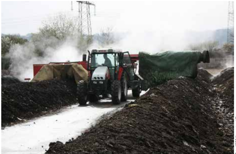
Bio-Abfälle werden in den Kompostier-Anlagen in der Umgebung zu Komposterde verarbeitet.