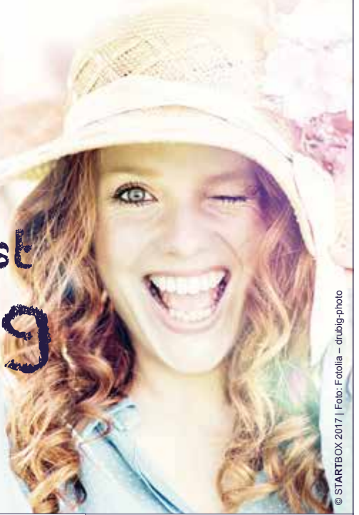
© STARTBOX 2017 | Foto: Fotolia - drubig-photo

Nicht nur Mamas freuen sich über einen entspannten Besuch im nanu.