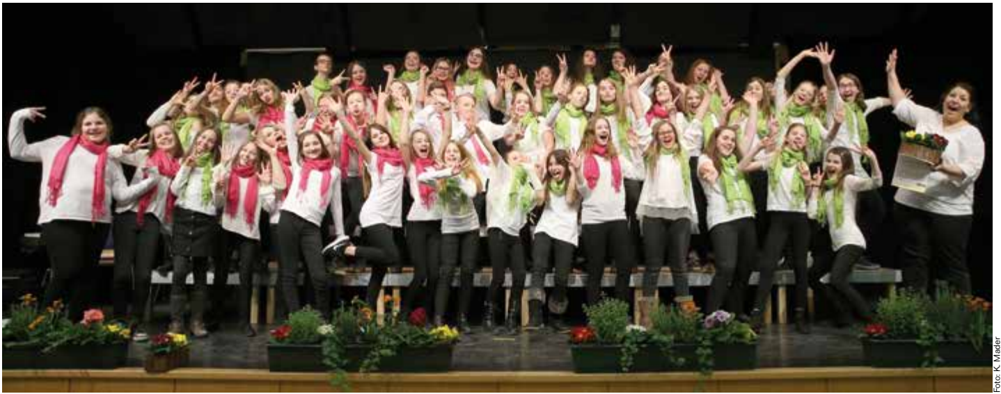
Die Neue Musik-Mittelschule Promenade lädt ein zum Frühjahrskonzert am 18. und 19. Mai im Stadttheater. Schwungvolle Songs, ein Live-Orchester und Tanzeinlagen werden das Publikum unterhalten.