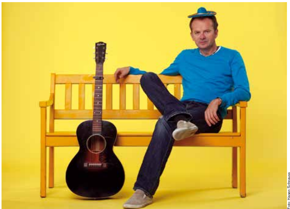
Willy Astor präsentiert sein Programm „Reim Time“ am 20. Mai im Stadtsaal. Der Reimer, Sänger und Gitarrist stellt seine neuen Kreationen aus dem Flunkerbunker vor.

Insgesamt neun Clubs aus der Region Steyr