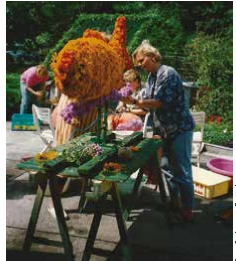
Der Siedlerverein Fischhub hat immer wieder an diversen Blumencorsos teilgenommen. Auf dem Foto schmückten Vereins-Mitglieder eine aufwändige Figur.