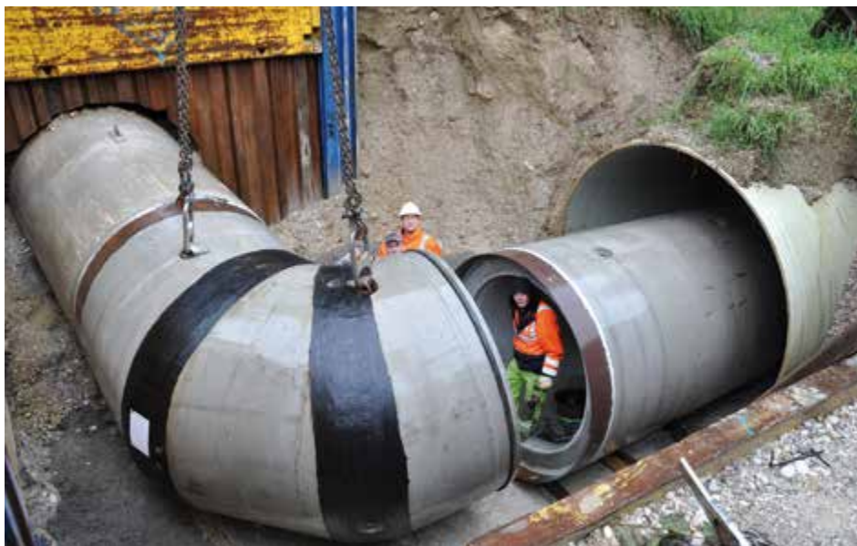
Der Kanal, der vom Stadtteil Tabor durch die Lauberleite gebohrt wurde (sog. Durchstich, links oben im Bild) wird an den Stauraumkanal im Bereich Steinwändweg (rechts) angeschlossen.

Sommer 2016: Bohrung von der Startgrube bei der Kreuzung Kaplangasse/Resthofstraße 229 Meter hinunter durch unterschiedlichste Gesteinsschichten in der Lauberleite zum Steinwändweg – bei 14 Prozent Gefälle! Anschluss dieses Kanalstückes an den vor drei Jahren errichteten Stauraumkanal (mit drei Metern Durchmesser) im Steinwändweg. Von hier fließen die Abwässer bei Starkregen in den Entlastungskanal zur Enns und über die sogenannte Drosselstrecke zur Kläranlage des Reinhaltungsverbandes Steyr und Umgebung.