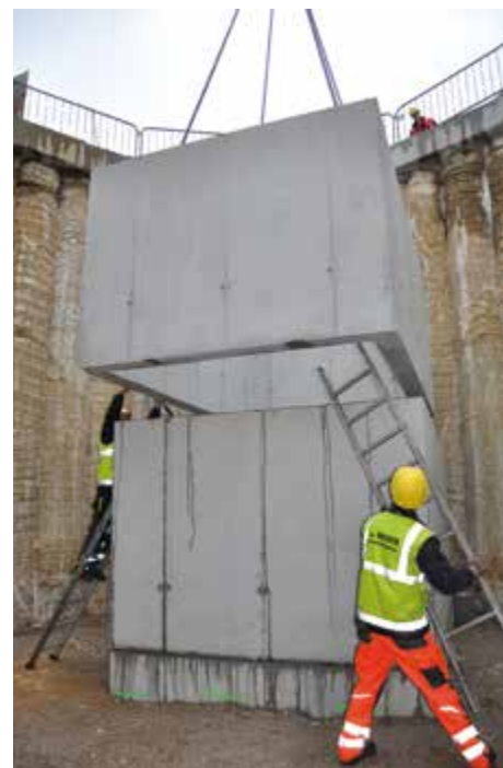
In der Startgrube bei der Kreuzung Kaplangasse/Resthofstraße wird der Schacht gesetzt.

Anfang 2016 wird die erste Bohrung durchgeführt – ein sogenannter Horizontalvortrieb auf ca. 200 Metern von der Startgrube zur Zielgrube.