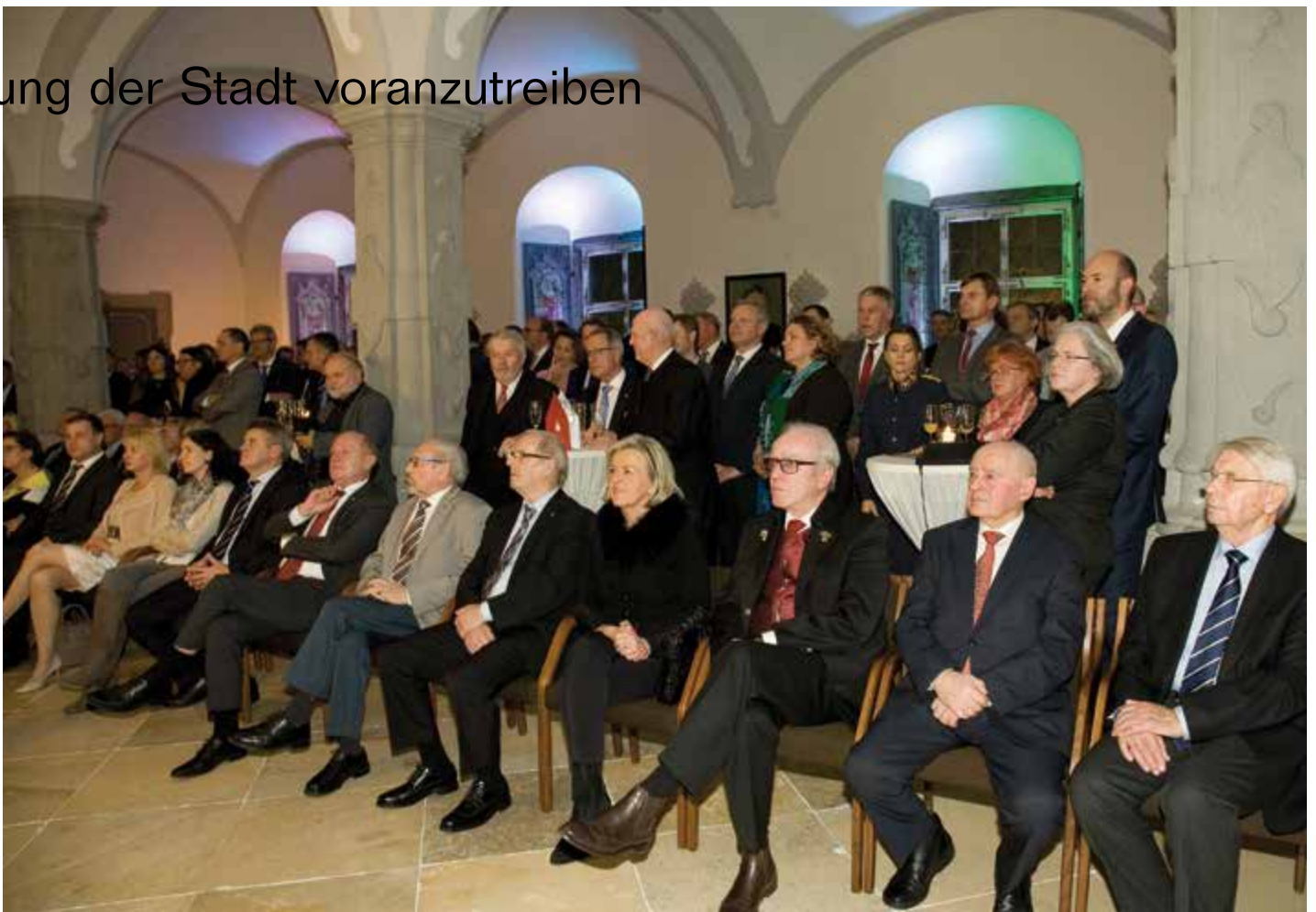
Mehr als 200 Gäste aus Wirtschaft, Politik, Verwaltung und anderen gesellschaftlichen Bereichen folgten der Einladung zum Bürgermeister-Empfang in den Rathaus-Festsaal.