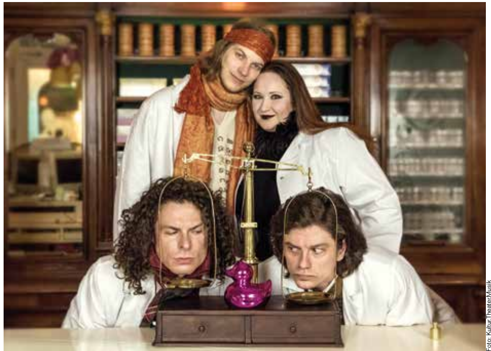
Der Apotheker – die komische Oper von Joseph Haydn – wird am 11. März im Alten Theater aufgeführt. In der Fassung des Ensembles von „Kultur.Theater.Musik“ ist der Apotheker Sempronio ein gutbürgerlicher Unternehmer von heute, Menghino ein sanfter, verliebter Hippie, Grilletta ein heimliches Punkgirl und Volpino der verwöhnte Sohn reicher Eltern.