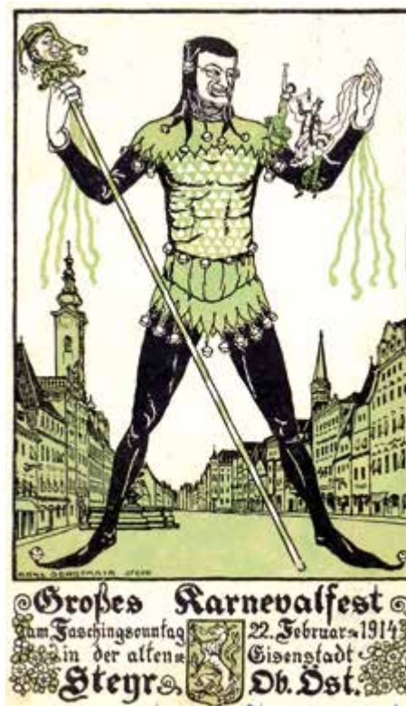
Karte Sammlung Schimanko

■ Der Tourismus boomt in Steyr, gezählt werden 100.000 Nächtigungen. In der Adventzeit und an den Wochenenden sind die Hotels in und um Steyr völlig ausgelastet. Laut erschallt