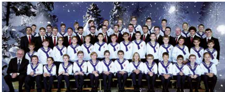
Die St. Florianer Sängerknaben und der Männerchor geben am 3. Dezember ein Konzert im Pfarrzentrum Münichholz.

Das US-Ensemble „The Sisters“ kommt mit Live-Band nach Steyr. Zu hören sind Höhepunkte der Verfilmungen mit Whoopi Goldberg. Karten erhält man bei Ö-Ticket und Raiffeisenbanken.