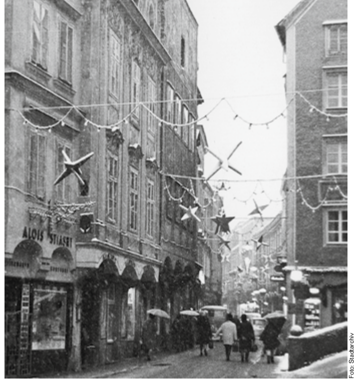
Die Enge Gasse wurde zum ersten Mal im Jahr 1962 mit einer Weihnachtsbeleuchtung geschmückt. Das Foto wurde 1966 aufgenommen.