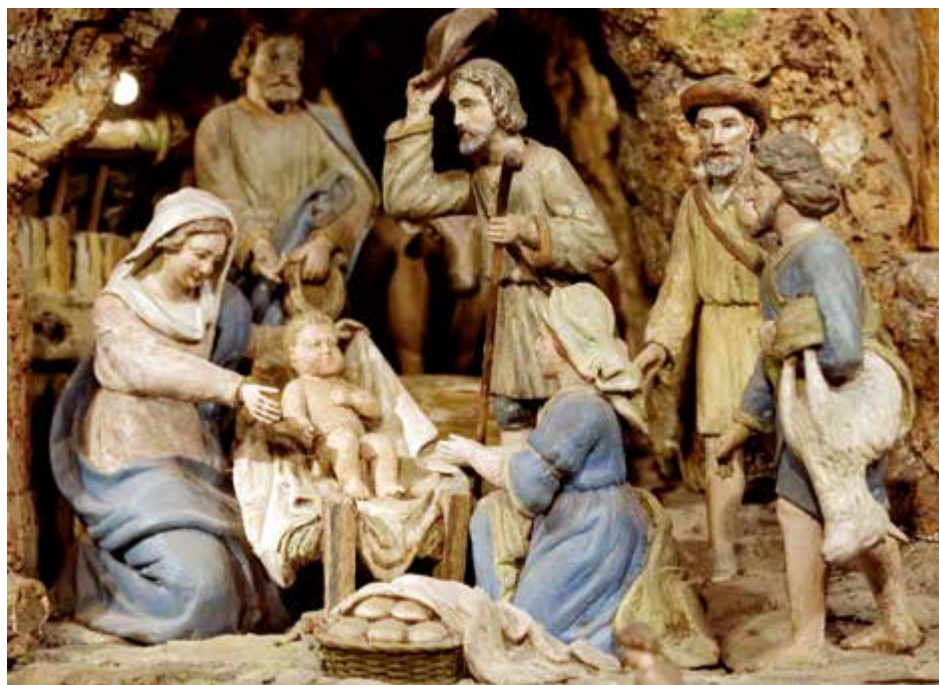
Zahlreiche Krippen werden in der Advent-Saison in Steyr gezeigt, wie z. B. die Mechanische Krippe im Wallfahrtsort Christkindl.

An die 30 Aussteller bieten exklusiv gestaltetes Kunsthandwerk zum Kauf an. Die Palette der Objekte umfasst die verschiedensten Materialien wie Gold und Silber, Glas, Holz, Kera-