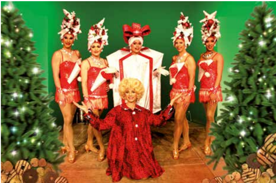
Die Herr...lichen Damen kommen wieder nach Steyr. Diesmal heißt ihr Programm „Eine HERRLICHE Bescherung“. Die Trastie-Show am 3. Dezember beginnt um 20 Uhr.

Wohl der Besucher gesorgt, ab etwa 16 Uhr werden die Perchten ihr Unwesen treiben. Verschiedene Aussteller bieten ihre Waren zum Kauf an.