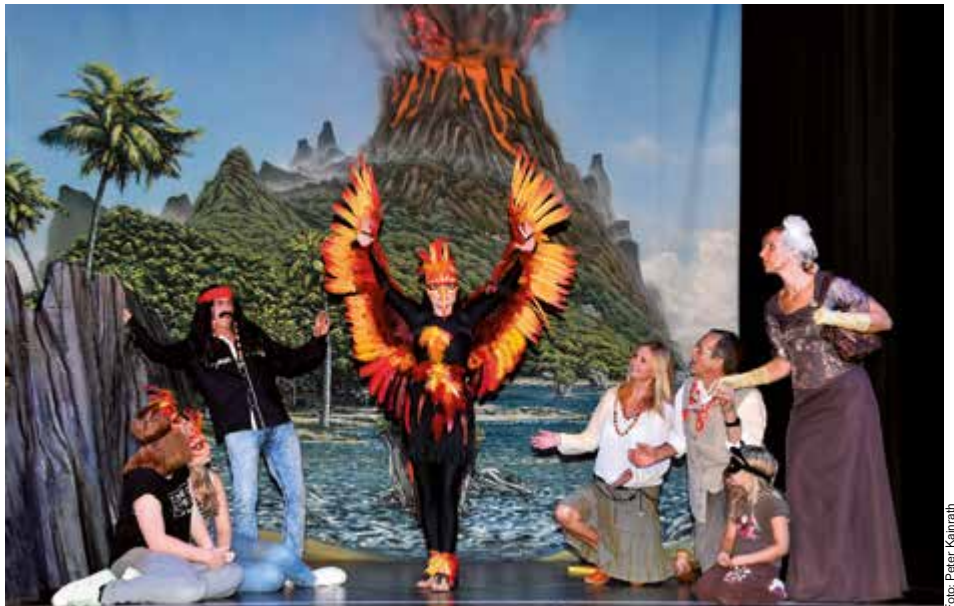
Die Steyrer Volksbühne führt ab 26. November wieder ein Theaterstück für Kinder auf. Der Feuervogel wird im Alten Theater insgesamt acht Mal gezeigt.

Inhalt: Auf einer exotischen Insel lebt ein geheimnisvoller Feuervogel. Niemand hat ihn je gesehen. Unheimliche Dinge erzählen sich die Inselbewohner von ihm. Besitzt sein Federkleid wirklich magische Kräfte? Kann eine Feder tatsächlich Wünsche wahr werden lassen? Ein Mädchen mit einem ganz besonderen Herzenswunsch begibt sich auf eine abenteuerliche Reise zum Feuervogel. Wird es ihn finden oder schnappen sich die listigen Vogelfänger und wilden Piraten den Feuervogel? Karten zu 12/10/8 Euro gibt es in allen Raiffeisenbanken und bei Ö-Ticket, Restkarten an der Theater-