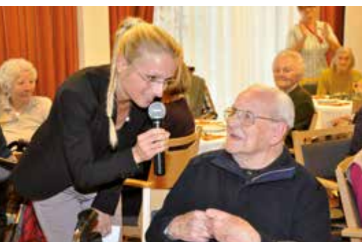
Menschen, die im Altenheim Ennsleite ein Zuhause gefunden haben, lobten die qualitätsvolle Pflege.