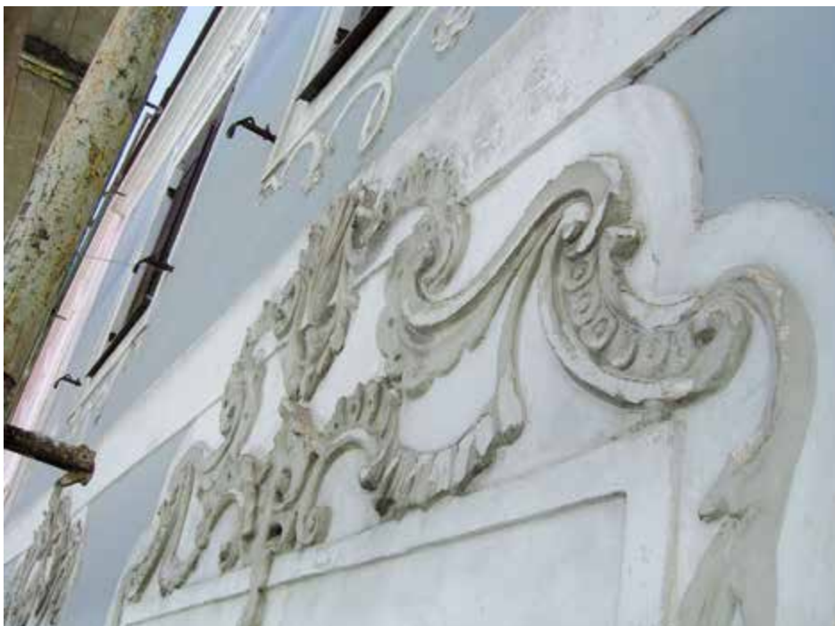
Reich verzierte Fassade eines historischen Hauses in Steyr. Es handelt sich um eine Kalkfassade mit Stuckornamenten.