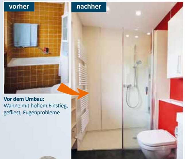
Vor dem Umbau: Wanne mit hohem Einstieg, gefliest, Fugenprobleme