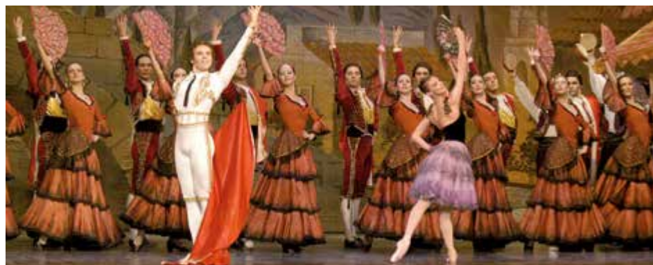
Am 6. Dezember wird im Stadttheater das Ballett „Don Quijote“ vom Ensemble der Tatarischen Staatsoper Kasan aufgeführt. Die Vorstellung beginnt um 19.30 Uhr