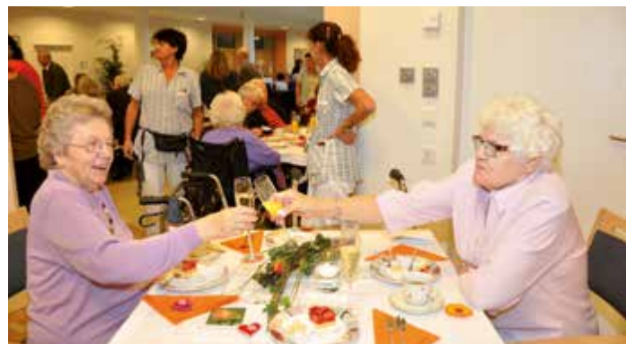
Heimbewohner konnten einen stimmungsvollen und fröhlichen Nachmittag genießen. Rüstige Seniorinnen stoßen auf das fünfjährige Jubiläum an.