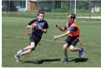
Die Steyrer Sportmittelschule bietet ein vielfältiges Bewegungsprogramm.

man sich an die Direktion der NMS/Musik-NMS Promenade unter Tel. 07252/53073-10 wenden.