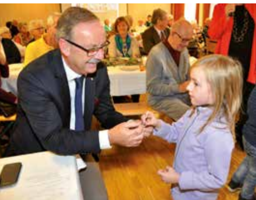
Die jungen Gäste verteilen selbstgebastelte Herzen – auch Stadtchef Gerald Hackl wurde beschenkt.