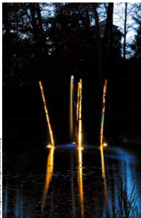
Das Wasserspiel ist in der Nacht beleuchtet.