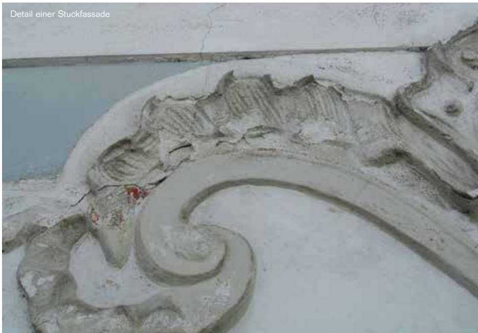
Detail einer Stuckfassade

Leinöl und Leinölfirnis sind im Altbau bei Behandlung von Holz, Sandstein, Eisen und Blech ein altbewährtes Mittel. Leinöl wird durch Pressung aus Samen des Flachses gewonnen. In den vergangenen Jahrzehnten wurden Leinölanstriche aufgrund der langen Trocknungsphase vermehrt durch Lacke und Kunstharzanstriche ersetzt. Seit einigen Jahren erkennt man wieder die Vorzüge des Materials und setzt es wieder vermehrt ein, z. B. bei Anstrichen von Kastenfenstern und Türen. Hauptvorteile sind der natürliche Holzschutz durch das sehr tief ins Holz eindringende Leinöl, die Diffusionsoffenheit und Elastizität des Anstriches. Zudem sind Leinölanstriche weniger wartungsintensiv. Als Pflegemaßnahme kann das Bindemittel durch ein in Leinöl getränktes Tuch wieder eingebracht werden. Durch die Wasserdampfdurchlässigkeit kann eindringendes Wasser an der Oberfläche des Holzes wieder verdunsten.