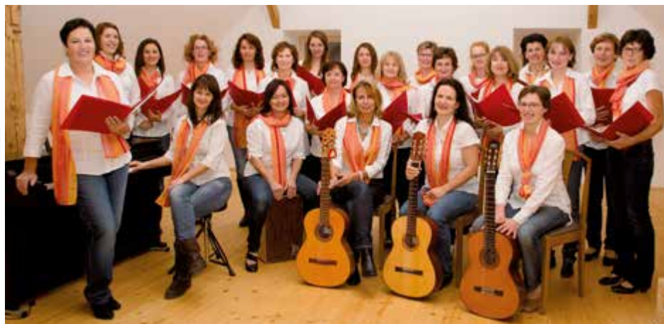
Die passende musikalische Begleitung bei der Weihnachtslesung kommt vom Aschacher Chor Aufwind.