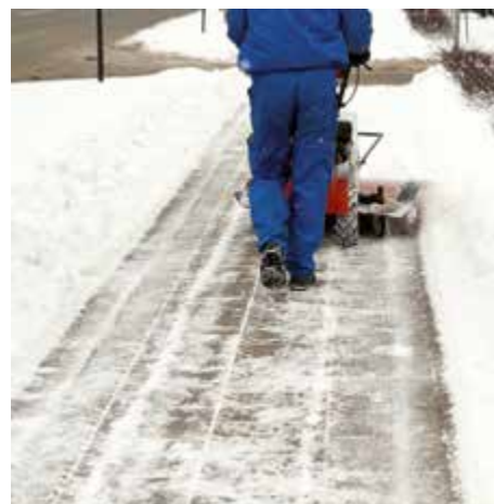
Anrainer sind in der Winterzeit zur Räumung und Streuung der Gehsteige und Gehwege entlang ihrer Liegenschaften verpflichtet.

Die Liegenschaftseigentümer werden deshalb höflich ersucht, dieser Verpflichtung, sowohl im Interesse der Fußgänger als auch in ihrem eigenen Interesse (Haftung bei Unfällen zufolge mangelhafter Schneeräumung und Streuung!), gewissenhaft nachzukommen, um damit wieder ein bequemes und gefahrloses Begehen der Gehsteige und Gehwege auch im kommenden Winter zu ermöglichen.