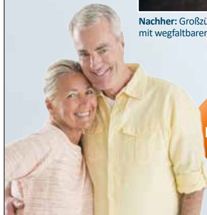
Nachher: Großzügige, barrierefreie Dusche mit wegfallbarer Trennwand, ohne Fliesen

JETZT KOSTENLOSEN BERATUNGSTERMIN VEREINBAREN!