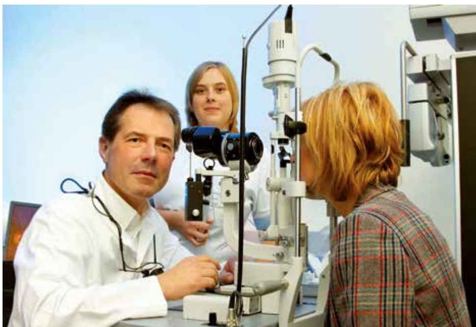
Gegen müde Augen im Büro gibt es einfache Hilfsmittel. Wenn diese jedoch nicht helfen, kann mit einer Augenuntersuchung festgestellt werden, ob es andere Gründe für die Beschwerden gibt.

Wer vom Office-Eye-Syndrom betroffen ist, sollte die Beschwerden jedoch nicht stillschweigend akzeptieren. „Fehlt es dem Sehorgan permanent an Flüssigkeit, so wird die Hornhaut anfälliger für Verletzungen. Zudem steigt auch das Risiko einer Bindehautentzündung, da Viren und Bakterien die natürlichen Abwehrmechanismen des Auges leichter überwinden können“, weiß Dr. Buder.