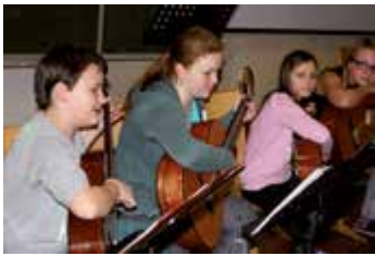
Schwerpunkt „Musik“ in der Neuen Mittelschule Promenade

Am Mittwoch, 23. November , veranstaltet die Neue Mittelschule (NMS) Promenade mit den Schwerpunkten „Musik“ sowie „Gesundheit & Beruf“ zwischen 8 und 12 Uhr einen Tag der offenen Tür. Von 17 bis 19 Uhr findet ein Informationsabend statt. Dabei werden Auskünfte zum musikalischen Schwerpunkt sowie zu den Hauptgegenständen Deutsch, Englisch und Mathematik erteilt. Für Eltern, die sich für den Musikschwerpunkt interessieren, findet um 18 Uhr ein spezieller Info-Vortrag statt. Im ganzen Haus stehen verschiedene musikalische Darbietungen auf dem Programm; krönender Abschluss dieses Abends wird der Auftritt des Schulchores sein. Für weitere Auskünfte kann