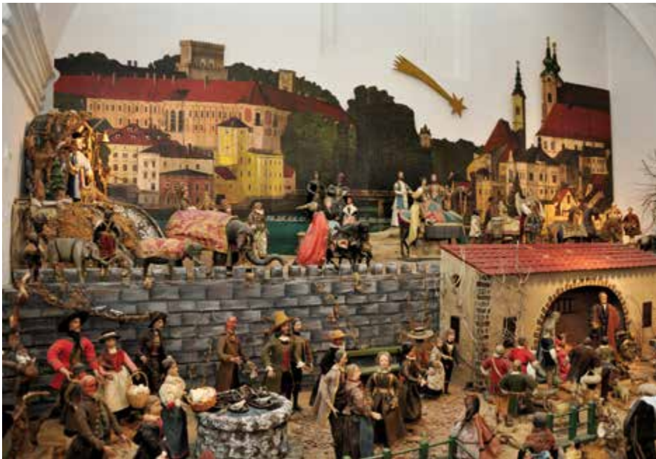
Die Lamberg'schen Krippenfiguren sind im Stadtmuseum ausgestellt – 200 Figuren aus der Sammlung der Grafen Lamberg, die zwischen der Barock- und Biedermeierzeit entstanden sind.