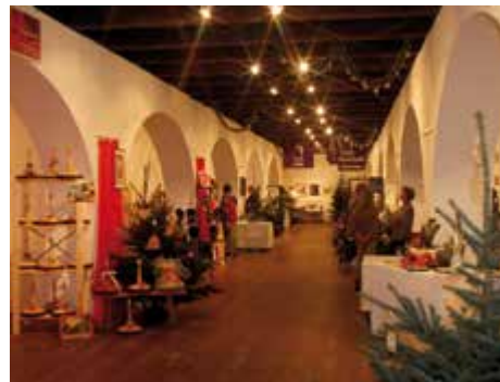
Foto: Weihnachten im Schloss

Auch heuer werden wieder an die 30 Aussteller exklusiv gestaltetes Kunsthandwerk zum Kauf anbieten. Die Palette der ausgestellten Objekte umfasst Materialbereiche wie Gold und Silber, Glas, Holz, Keramik, Naturprodukte, Metall, Textilien und Antiquitäten sowie verschiedene Köstlichkeiten aus der Region.