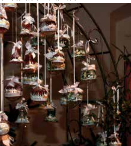
Foto: Weihnachten im Schloss

Weihnachtseinkäufe mit einem Besuch des Adventmarkts verbinden kann man in der Steyrer Altstadt.