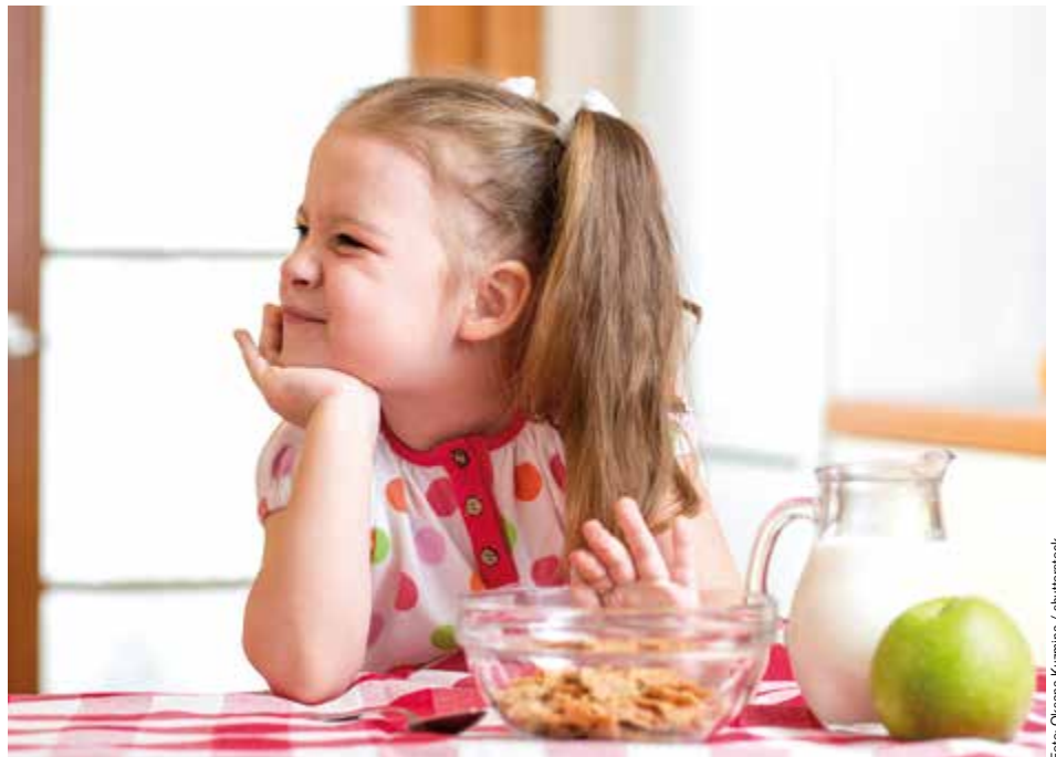
Kinder verweigern sehr oft gesundes und nahrhaftes Essen. Mit ein paar Tricks kann man sie motivieren, Gesundes und Neues aus dem Menüplan zu kosten.