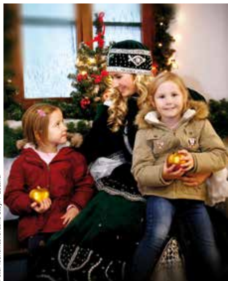
Märchenstunde mit dem Steyrer Christkindl

Von 28. November bis 20. Dezember Sa und So sowie am 7. und 8. Dezember um 13.30 Uhr im Weihnachtsmuseum, um 16 Uhr gemeinsam mit den Adventbläsern beim Christkindlmarkt auf der Promenade und um 17 Uhr gemeinsam mit den Adventbläsern beim Adventmarkt „Altstadt Steyr“. Samstags sowie am 7. und 8. Dez. gibt es um 15 Uhr eine Märchenstunde beim Adventmarkt „Altstadt Steyr“ und sonntags um 15 Uhr beim Christkindlmarkt auf der Promenade.