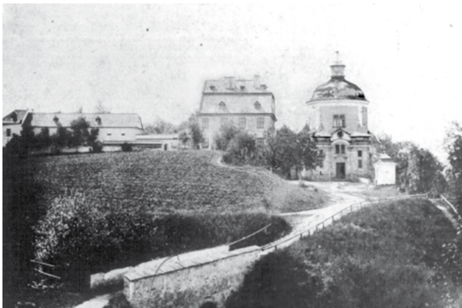
Foto der 1702 bis 1709 gebauten Wallfahrtskirche Christkindl, aufgenommen um 1875. Auf diesem Foto sind die ursprünglich niedrigen Kirchtürme zu sehen, welche 1880 vom Linzer Dombaumeister Otto Schirmer umgebaut und erhöht worden sind. Rechts befindet sich die Nepomuk-Kapelle, links der mächtige Pfarrhof. Noch nicht zu sehen ist die erst 1876 fertiggestellte Loreto-Kapelle, die sich heute links vor der Kirche befindet.

■ „Volkskunst und Laienschaffen“ betitelt sich schlicht die acht Tage währende Ausstellung im Schulungsraum des Gemeinschaftshauses, in der Schaffende der Steyr-Werke aus Steyr und Graz sowie Schüler der Volkskunstgemeinschaft die Arbeiten ihrer Freizeit zur Schau stellen. Den größten Platz im künstlerischen Freizeitschaffen nehmen dabei Malerei und Zeichnungen ein.