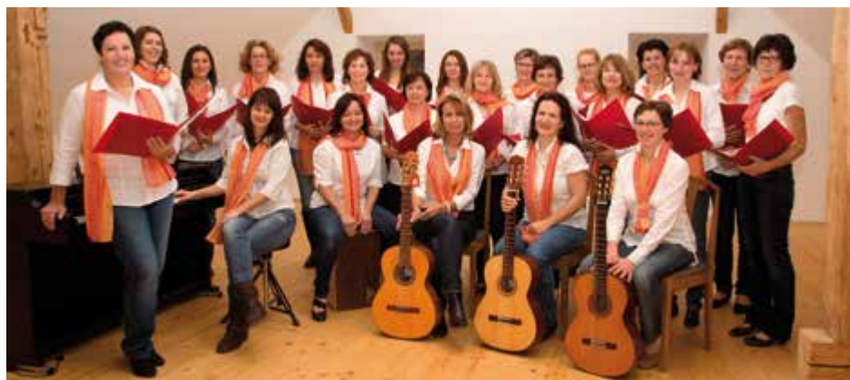
Die passende musikalische Begleitung bei der Weihnachtslesung kommt vom Aschacher Chor Aufwind.