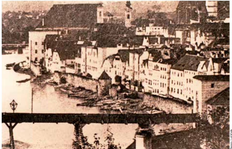
Das wahrscheinlich älteste Foto von Steyr zeigt den Ennskai mit der mächtigen Mauer der Stadtbefestigung.

Befestigung bot, wurde am 27. Jänner 1857 mit dem Abbruch derselben begonnen. Mit der Errichtung des Ennskais ging auch der Bau der Innenstadtkanalisation einher, womit für die Stadt eine neue Ära der Sauberkeit und Hygiene begann.