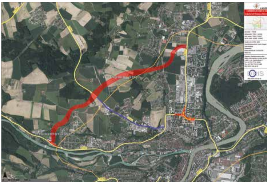
Die Oberösterreichische Landesregierung hat die Trassenverordnung für die Westspange (rot markiert) beschlossen.

Die geplante Westspange führt auf einer Länge von 4,1 Kilometern von der B 115, Zufahrt