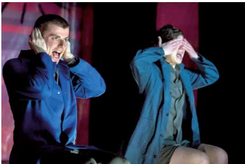
Die Jugendtheatergruppe Osonó aus Rumänien macht am 5. und 6. September Station in Steyr. Sie präsentiert ihr Stück „As water reflects the face“. Auch ein Theaterworkshop mit den jungen Schauspielern wird angeboten.

Am 6. September findet von 14 bis 17 Uhr im Dominikanersaal ein Theaterworkshop statt, der von Mitgliedern der Theatergruppe Osonó geleitet wird. Er ist gedacht für Jugendliche und Erwachsene, die Lust am Ausprobieren und gemeinsamen Erleben von verschiedenen Theaterübungen und -spielen haben. Nicht das gesprochene Wort steht im Vordergrund,