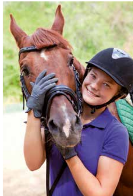
Halter von Pferden, Eseln, Ponys und anderen Equiden benötigen für ihre Tiere ein Identifizierungs-Dokument. Der Pass muss auch immer mitgeführt werden.