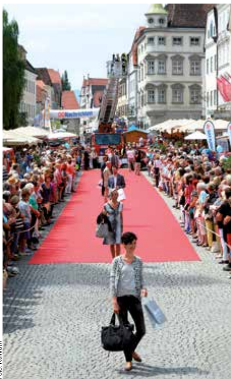
Mehr als 100 Models werden die neuesten Mode- und Lifestyle-Trends präsentieren.

11 – 12 Uhr: Mode- und Lifestyle-Trends werden auf dem Stadtplatz präsentiert von mehr als 100 Models. Den Auftakt startet der Vespaclub Steyr mit einer Showeinlage der Tanzgruppe ÖTB Eberschwang. Auffahrt von Rennautos – Team Terschll