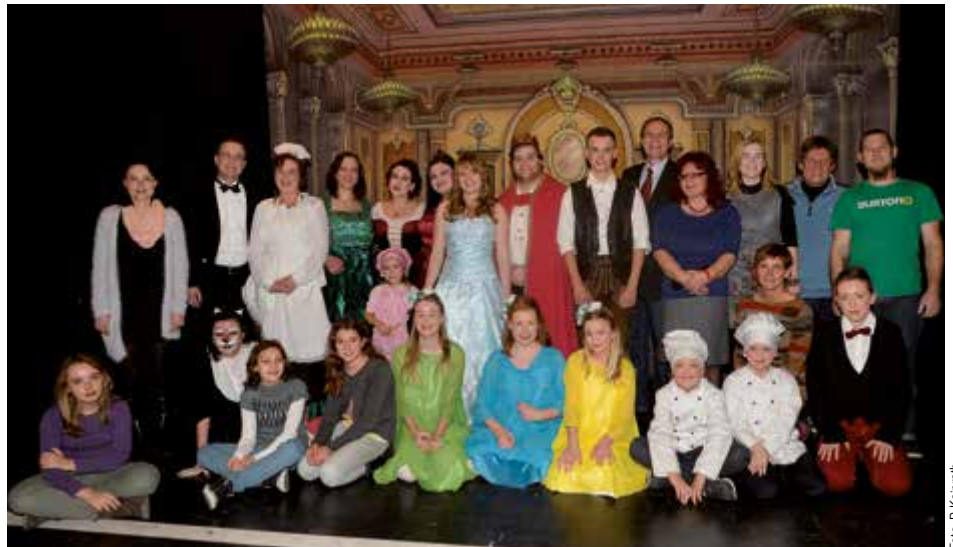
Die Steyrer Volksbühne wird heuer 50 Jahre alt. Das Ensemble (im Bild oben) feiert das Jubiläum mit der Boulevard-Komödie „Boeing – Boeing“ und dem Märchen „Hänsel und Gretel“.