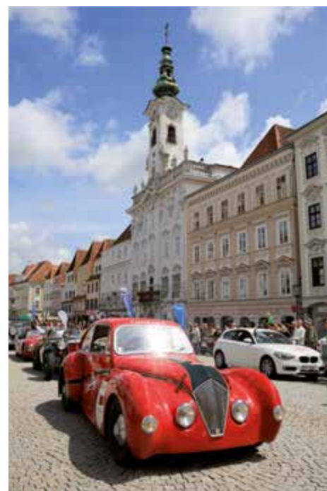
Die Ennstal-Classic macht wieder Station in Steyr. Am 17. Juli können schöne Oldtimer hautnah bewundert werden.