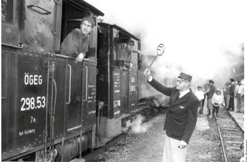
Vor 30 Jahren, am 15. Juni 1985, nahm die Steyrtalbahn auf der Strecke Grünburg – Steyr als Museumsbahn ihren Betrieb wieder auf. 1982 hatten die ÖBB den Bahnbetrieb eingestellt. Die Vereine „Österreichische Gesellschaft für Eisenbahngeschichte“ und „Pro Steyrtalbahn“ haben sich dafür eingesetzt, dass die Steyrtalbahn wieder fährt.