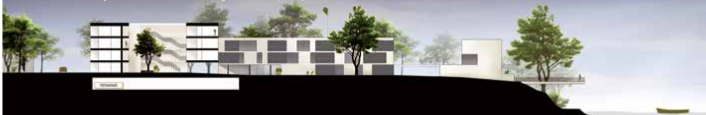
Süd-Ost-Ansicht des Projekts Schlüsselhof mit dem Steg an der Enns (rechts)

Das „Nachrüstprogramm“ mit außenstehenden Liftanlagen bei den GWG-Wohnbauten wird weiter verfolgt, 2014 wurden die Lift-Anlagen bei den Gebäuden Arbeiterstraße 28 sowie Kohlanger 9 und 10 errichtet. Heuer sind Lifte für die Stiegenhäuser Keplerstraße 8, Pointnerstraße 4 und Kohlanger 11 vorgesehen. Die Investitionen dafür belaufen sich auf 342.000 Euro. 2014 wurden die Gebäude Steinfeldstraße 3, 4, 6 und 8 generalsaniert. Dafür wurden von der GWG 1.241.000 Euro investiert.