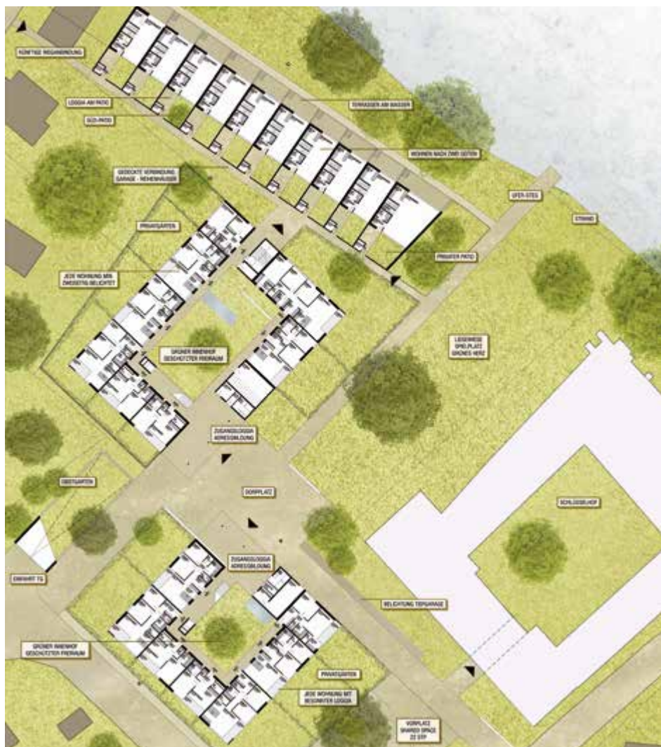
Plan des Projekts-Schlüsselhof: Es sieht vor, den bestehenden Schlüsselhof (rechts im Bild) mit zwei weiteren Gebäuden zu einem Ensemble in einem Park zu ergänzen. Im Hintergrund an der Kante zur Enns sieht man die geplanten Reihenhäuser.

Das Vorhaben umfasst zwei Etappen: im ersten Bau-Abschnitt werden 12 Reihenhäuser (Eigentum) und 28 Eigentums-Wohnungen (2-Raum, 3-Raum und 4-Raum) gebaut. Die 2-Raum-Wohnungen werden eine Wohnfläche von 45 bis 50 Quadratmetern haben, die 3-Raum-Wohnungen sollen zwischen 75 und 80 Quadratmeter und die 4-Raum-Wohnungen 80 bis 95 Quadratmeter groß sein. Baubeginn wird voraussichtlich im Frühjahr 2016 sein, bezugsfertig werden die Gebäude der ersten Etappe 2018 sein.