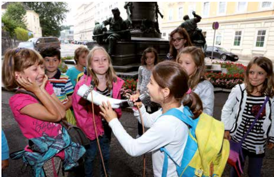
Beim Sommer-Ferien-Programm wird Kindern zwischen 6 und 14 Jahren Abwechslung in der Ferienzeit geboten. Spannend und vor allem Spaßig ist die Tour „Geheimnisvolles Steyr“.

Bei dieser Tour durch die Altstadt von Steyr erfahren Kinder etwas über unbekannte Ziffern, geheimnisvolle Zeichen in Steinen, Kano-