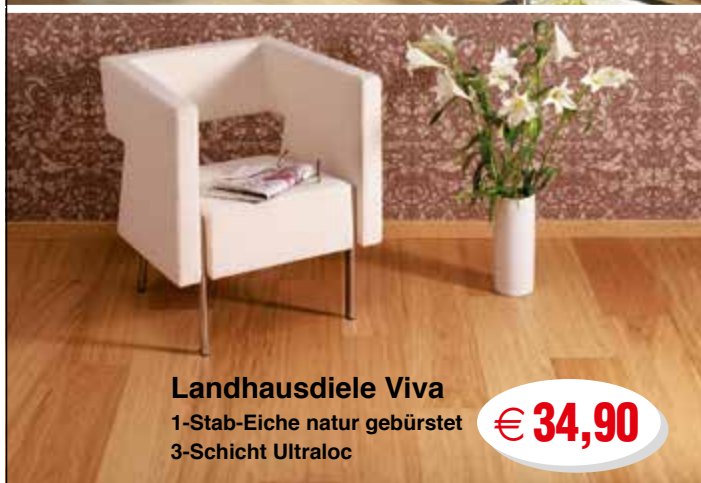
Landhausdiele Viva 1-Stab-Eiche natur gebürstet 3-Schicht Ultraloc

KÖNIGSBERG Standardtür glatt CPL quer Wälder-Boyer-Produktion 850 x 2100 x 150 mm 1 Türblatt mit Rostkante, Höhenverstellung einlage, Farbe KONFIERE 1