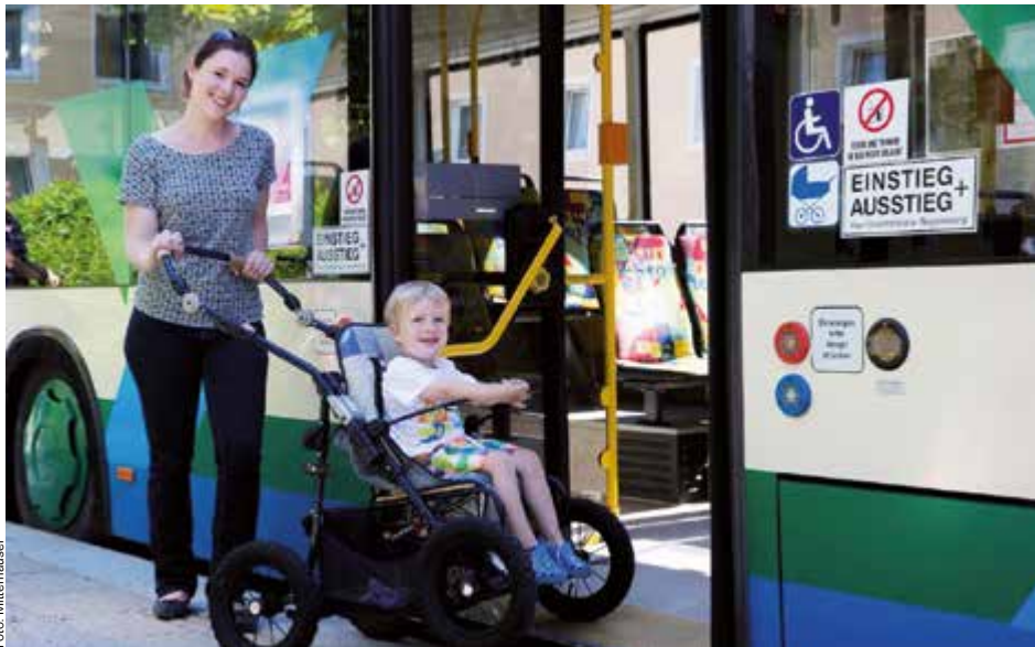
Beim Mobilitätstag am 20. September dreht sich alles rund um die Themen Mobilität und öffentlicher Verkehr.

Am Sa, 20. September , dreht sich von 8.30 bis 12.30 Uhr auf dem Steyrer Stadtplatz alles um die Themen Mobilität und öffentlicher Verkehr. Neben dem Stadtbus Steyr, dem Oö.