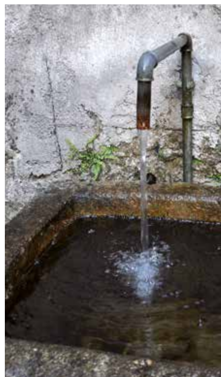
Bei der jährlichen Untersuchung des Steyrer Trinkwassers wurde dessen einwandfreie Qualität bestätigt.

Weitere Untersuchungsparameter findet man auf www.stadtbetriebe.at/wasser → Downloads.