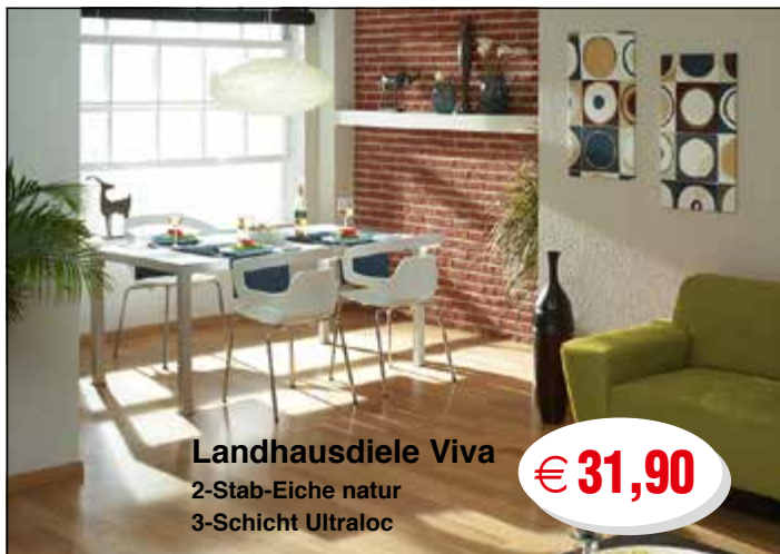
Landhausdiele Viva 2-Stab-Eiche natur 3-Schicht Ultraloc