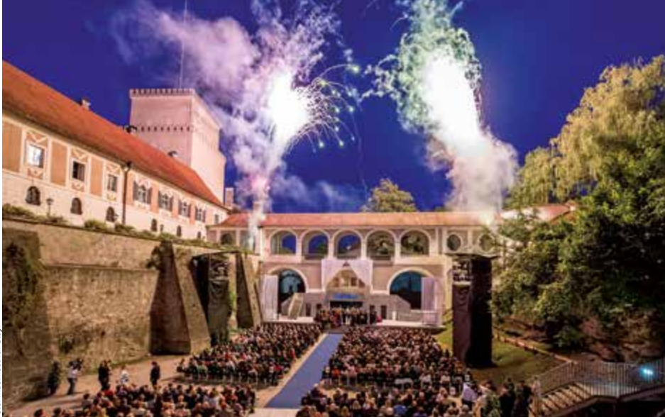
Beim 20. Steyrer Musikfestival stand u. a. die Johann-Strauss-Operette „Die Fledermaus“ auf dem Programm. Fast alle Vorstellungen konnten im Schlossgraben aufgeführt werden.