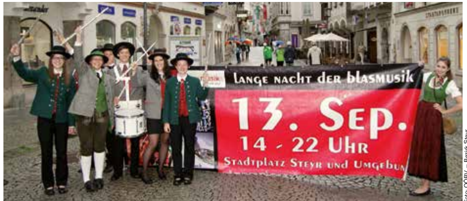
Blasmusik in all seinen Facetten wird am 13. September ab 14 Uhr in Steyr präsentiert. Höhepunkt wird der gemeinsame Auftritt von etwa 1500 Blasmusikern sein.

17.30 Uhr: Konzertblock Steyr – Gleink – Christkindl; 17.45 Uhr: Marschblock Adlwang – Grünburg; 18 Uhr: Konzertblock Sierning – Schiedlberg – Wolforn; 18.15 Uhr: Marschblock Neustift – Pechgraben – Ternberg; 18.30 Uhr: Konzertblock Dietach – Sulzbach – St. Ulrich; 18.45 Uhr: Marschblock Hilbern – Rohr