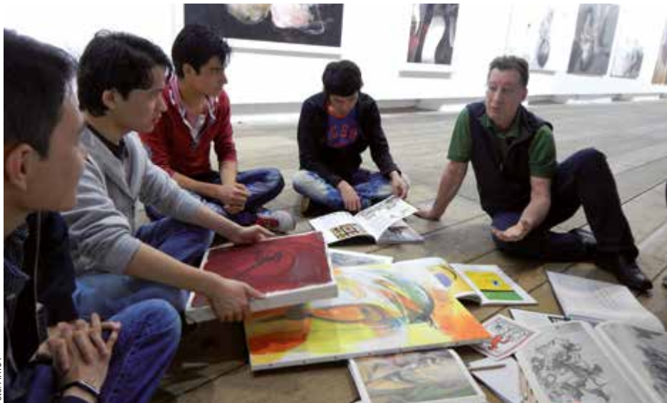
Die Steyrer Kunstgruppe ART64 hat bei einem sozialen Projekt jungen Männern aus Kriegs- und Krisengebieten den Weg zur Malerei gezeigt. Die dabei entstandenen Werke werden bei der Jubiläums-Ausstellung ab 12. September in der Schlossgalerie präsentiert.

ART64 engagiert sich auch für Menschen, die mit schweren Schicksalsschlägen zu kämpfen haben: Die Gruppe hat vor kurzem elf jungen Männern aus Kriegs- und Krisengebieten wie Afghanistan, Syrien, Somalia und Bangladesh den Weg zur Malerei gezeigt. Die dabei entstandenen Werke werden bei der Jubiläums-Ausstellung im September präsentiert.