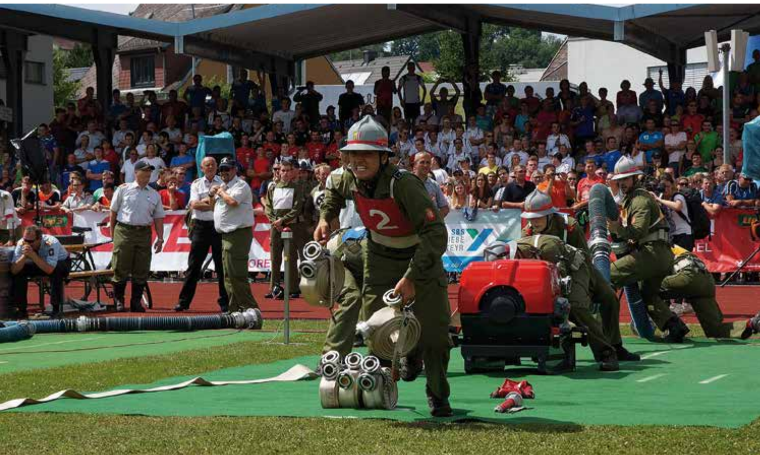
Voller Einsatz des Löschzugs 4 Christkindl der Steyrer Feuerwehr beim Aufbau der Löschleitung. Der sogenannte Löschangriff ist ein Teil des Leistungsbewerbs.