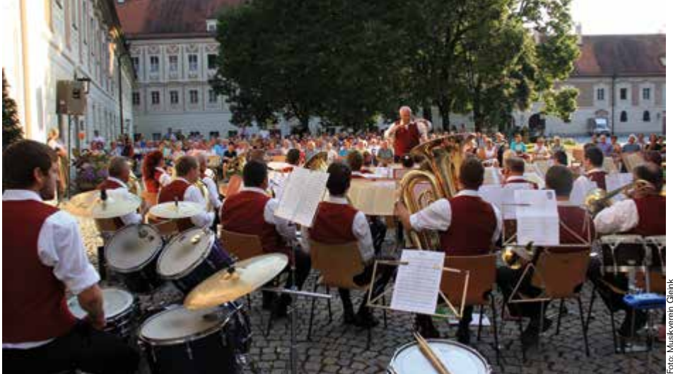
Im stimmungsvollen Ambiente des Hofes von Schloss Lamberg finden bei freiem Eintritt jeden Freitag bei Schönwetter um 18.30 Uhr Konzerte mit Musikkapellen aus Steyr und Umgebung statt. Auf dem Bild ist der Musikverein Gleink zu sehen.

Es treten auf: Brauchtanz, Querpfeifer, Das Großmütterchen Hatz Salon Orkestar. Der Eintritt ist frei. Infos auf www.aufdagassn.at .