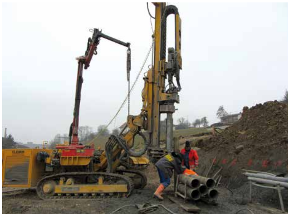
261 Pfähle wurden zur Stabilisierung des Rutschhangs Roglwiese in den Untergrund eingebracht.

Aufgrund des Hochwassers im Juni des Vorjahres erlitt der Stützpfiler der Rederbrücke eine Schrägstellung. Wir sind mit einem blauen Auge davongekommen, denn das rasche Handeln und die Zusammenarbeit zwischen Land OÖ und Stadt Steyr haben Schlimmeres verhindern können. Die Bauarbeiten sind abgeschlossen, der Pfeiler der Landesbrücke wurde nun tief im Bodenuntergrund verankert. Ein bei der TU Graz beauftragtes Gutachten soll nun die genaue Ursache dieser Pfeilerverschiebung klären. Über die Kostenaufteilung zwischen Land, Stadt und Katastrophenfonds wird sodann verhandelt.