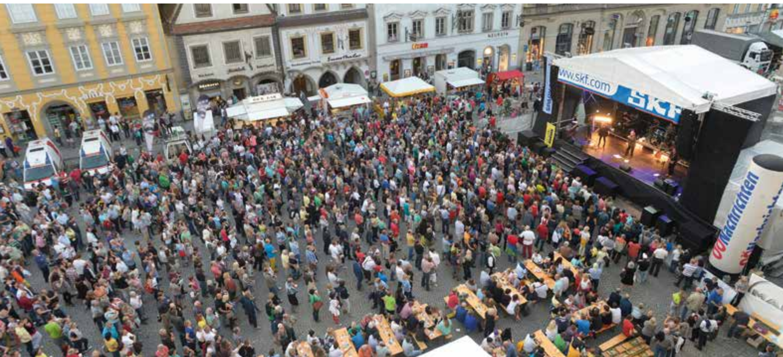
Das Eröffnungskonzert mit der Gruppe Opus war gut besucht.