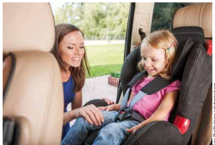
Schützen Sie Ihr Kind im Auto durch die korrekte Nutzung und Montage eines altersgerechten Kindersitzes.