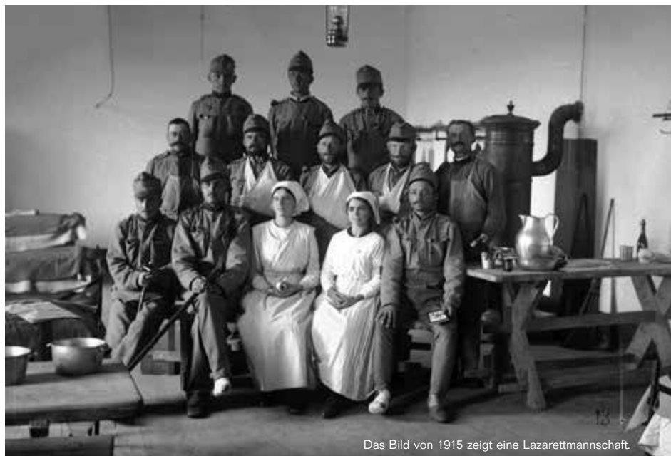
Das Bild von 1915 zeigt eine Lazarettmannschaft.

Der folgende Krieg wurde bekannterweise zur „Urkatastrophe des 20. Jahrhunderts“ und endete nach vier Jahren im Herbst 1918. Er forderte fast zehn Millionen Todesopfer und etwa 20 Millionen Verwundete unter den Soldaten. Die Anzahl der zivilen Opfer wird auf weitere sieben Millionen geschätzt.