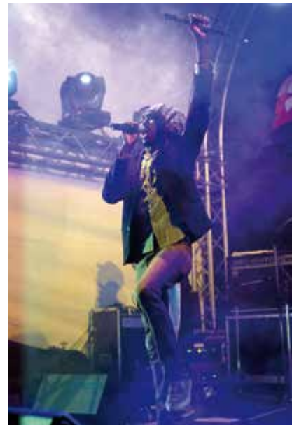
Zahlreiche Musiker sorgten für Unterhaltung. Auf dem Foto Anthony B beim Grünlandfest im Schlosspark.