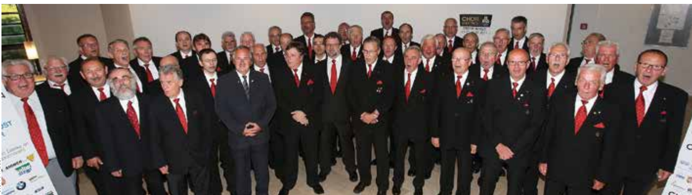
Der Steyrer Männergesangsverein Sängerkunst feierte heuer seinen 170. Geburtstag und wurde ausgezeichnet.

Verdienstmedaille des oö. Chorverbandes und hat weiters mit seinem Konzept die landesweite Ausschreibung zur Nachwuchspflege gewonnen.