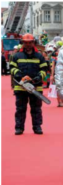
Die Feuerwehr Steyr präsent