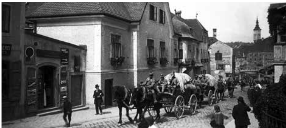
Ausrücken an die Front, August 1914

Ein paar Tage später liest sich der reale Kriegsbeginn so: „Wie ein Lauffeuer ging am 30. August nachmittags die Nachricht durch unsere Stadt, als die allgemeine Mobilisierung angeordnet wurde. Die im wehrfähigen Alter stehenden Männer eilten von der Arbeit weg, um sich die Nachricht bestätigen zu lassen. Gegen 5 Uhr wurden die ersten Einberufungsplakate angeschlagen. Das Rathaus hatte einen förmlichen Sturm zu bestehen, so stark war das Gedränge der Einrückungspflichtigen, die ihre Abmeldung vollzogen. Nirgends war eine niedergeschlagene Stimmung zu bemerken, im Gegenteil, helle Freude leuchtete den Einberufenen aus den Augen. (...) Punkt 8 Uhr