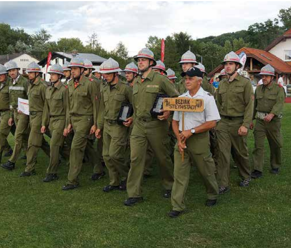
Steyrer Feuerwehr beim Ausmarsch nach der Siegerehrung