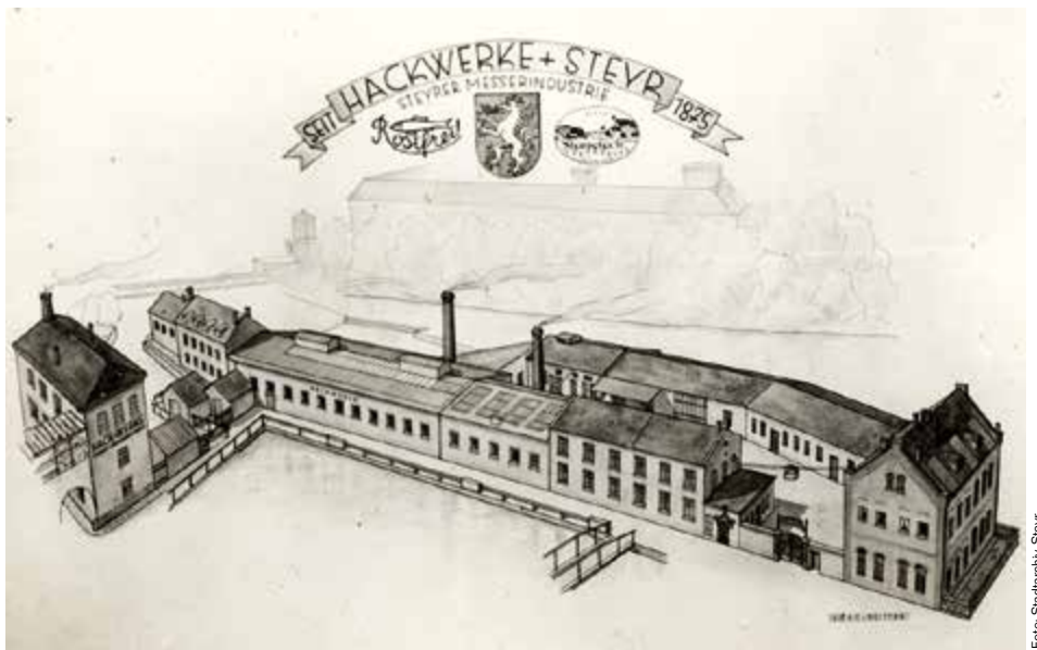
In den 1875 gegründeten Hack-Werken im Wehrgraben wurde Besteck produziert. Im Jahr 1923 wurden hier die ersten rostfreien Klingen Österreichs hergestellt, zwischen 1946 und 1948 wurde der Wellenschliff eingeführt.