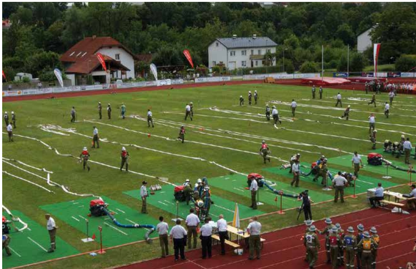
Teilnehmer der S

Vollbetrieb herrschte auf den Bahnen. Auf dem Rasen kuppelten die Aktiven blitzschnell Saugschläuche, legten Löschleitungen und Schläuche aus, schlossen Verteiler und Strahlrohre an.