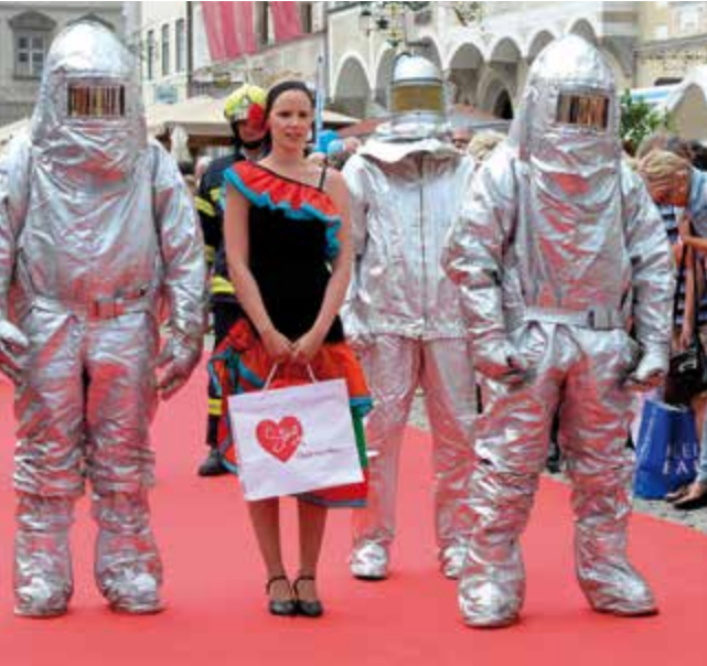
enterte ihre Einsatzkleidung.