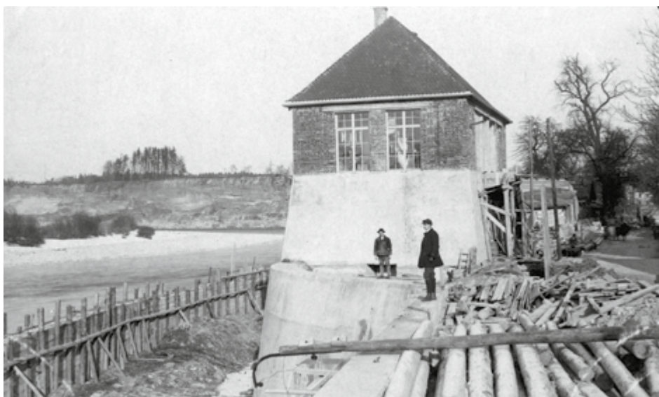
Das Foto zeigt das Pumpwerk an der Haratzmüllerstraße im Jahr 1914. Es ist heute noch in Betrieb und beliefert u. a. die Steyrer Firmen MAN, ZF, SKF und SLR mit Wasser für Kühlzwecke und Feuerlöscheinätze.

■ Mehr als 1.000 Briefmarkenfreunde aus allen österreichischen Bundesländern besuchen den 5. Briefmarkengroßauschtag im Hotel Münichholz. Die Postverwaltung hat dazu im Hotel ein Sonderpostamt eingerichtet, das mehr als 7.000 Sonderstempel und 200 Sätze der Olympiaserie abgibt. Der Briefmarkenclub Steyr-Münichholz ist der zweitgrößte in Öster-