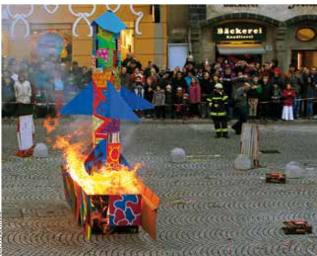
Bereits zum dritten Mal hatten die Kinder des Kindergartens und Hortes Wokralstraße dabei geholfen, die Raketen zu schmücken, die beim Faschingsausklang auf dem Stadtplatz verbrannt wurden.

Eine fünfköpfige Delegation aus der Stadt Laktaši in Bosnien und Herzegowina besuchte vor kurzem die Magistratsabteilung für Kinder- und Jugendhilfe. Bei dem Besuch wurden u. a. folgende Fragen zum Thema Kinder und Jugendhilfe erörtert: Wie verlaufen Betreuungen von Kindern und Jugendlichen aus belasteten Familien? Wie werden beeinträchtigte Jugendliche unterstützt und wenn nötig untergebracht? Wie wird Jugendlichen bei der Job- oder Lehrstellensuche geholfen? Nicht nur die Gäste aus Laktaši erhielten nützliche Informationen, auch die Mitarbeiter der Stadt Steyr konnten sich einen Eindruck der Arbeit der Gäste machen, die bedingt durch ihre finanzielle Beschränkung sehr oft kreative Ansätze für ihre Tätigkeit finden müssen. Mit bei der Delegation aus Laktaši war auch der Vizebürgermeister Ognjen Vulin, er lud Vertreter der Jugendhilfe zu einem Gegenbesuch ein, damit sie vor Ort über ihre Erfahrungen und Kompetenzen in der Kinder- und Jugendhilfe berichten können.