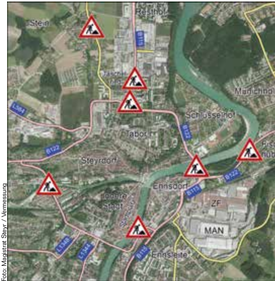
Die Grafik zeigt einen Überblick über die verkehrsbehindernden Großbaustellen 2014 in Steyr.

Aufgrund der Großprojekte werden unsere städtischen Straßensanierungen in diesem Jahr weg von den Hauptstraßen auf Nebenstraßen verlegt. Folgende Straßensanierungen sind geplant: