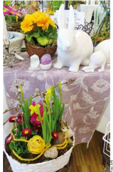
Beim Oster- und Frühlingmarkt im Altenheim Ennsleite am 8. April kann man neben Gestecken, Geschenkartikeln und Kunsthandwerk auch kulinarische Köstlichkeiten erwerben.

Am Di, 8. April, findet im Alten- und Pflegeheim Ennsleite (APE) am Steinbrecherring von 13 bis 17 Uhr ein Oster- und Frühlingmarkt statt. Dabei werden Türkränze, Palmbissen, Ostergestecke, kleine Geschenkartikel, Kunsthandwerk, Ostereier, kulinarische Köstlichkeiten und hausgemachte Mehlspeisen zum Kauf angeboten. Der Reinerlös aus dieser Veranstaltung wird für Aktivitäten mit den Heimbewohnerinnen und -bewohnern verwendet.