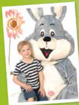
Foto mit dem Osterhasen

Das City Point Team steht Dir am 12. April ab 10:00 Uhr mit Rat und kreativen Ideen zur Seite.