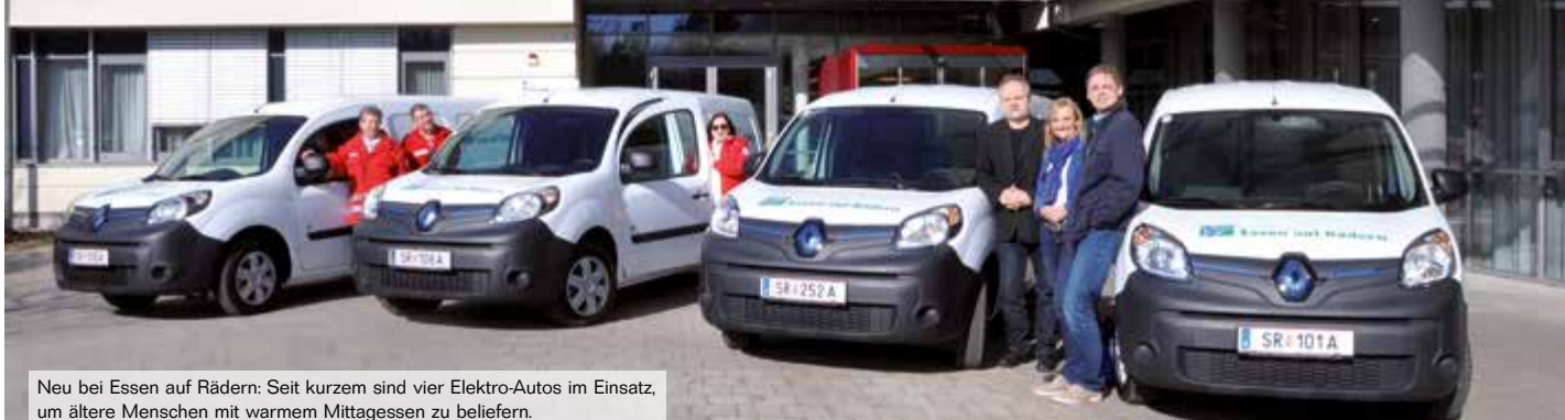
Neu bei Essen auf Rädern: Seit kurzem sind vier Elektro-Autos im Einsatz, um ältere Menschen mit warmem Mittagessen zu beliefern.