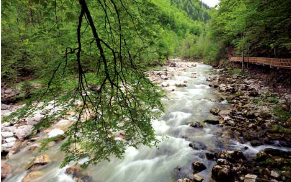
Die Natur genießen kann man beim Wandern im Weißenbachtal in Reichraming.

Der Themen-Rundweg: Vom Parkplatz Weißenbach folgt man der Markierung „Im Tal des Holzes“. Man überquert den Reichramingbach, und entlang des Großen Weißenbachs er-