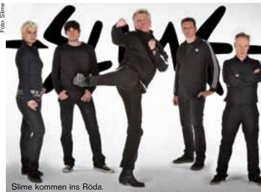
Slime kommen ins Röda.

Die Veranstaltungen finden im Haus der Frauenstiftung, Wagnerstraße 2—4 statt. Um telefonische Anmeldung unter 07252/87373 wird gebeten. Bei Bedarf wird auch Kinderbetreuung angeboten.