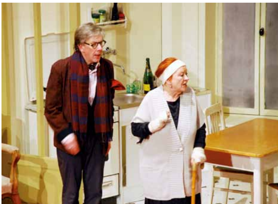
Zusammen ist man weniger allein – die Komödie rund um Alltagsprobleme wie Älterwerden, Scheidungen, Einsamkeit und Liebeskummer steht am 19. September auf dem Kulturprogramm. Beginn der Vorstellung im Stadtheater ist um 19.30 Uhr.

Auf dem Weg durch die Stadt richten die Teilnehmer die Aufmerksamkeit auf das Leben