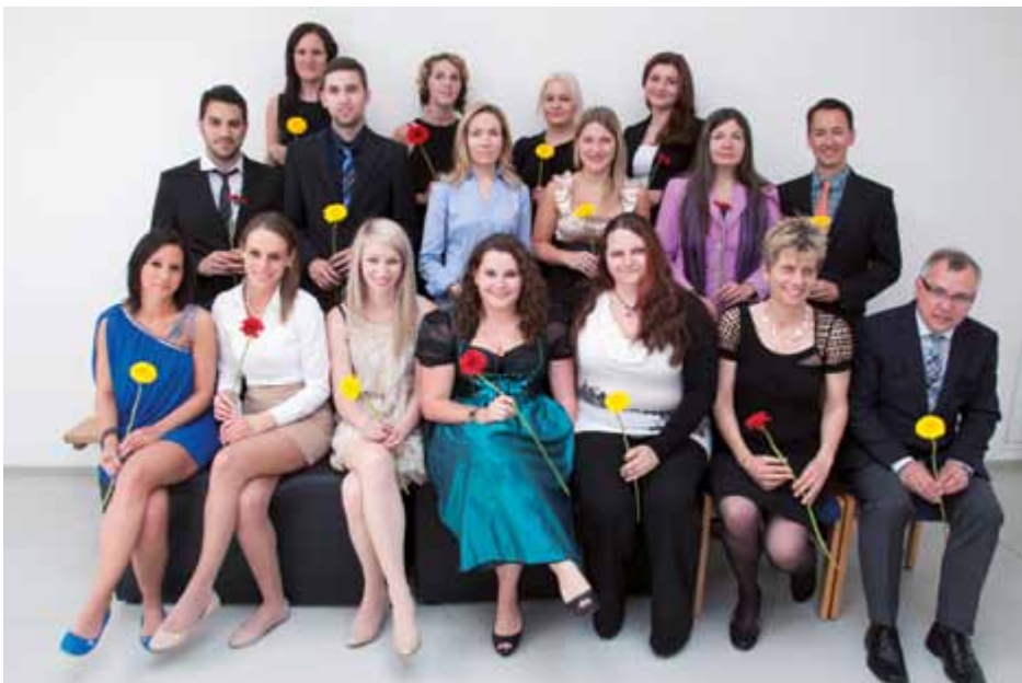
Die Maturanten der Steyrer HAK für Berufstätige – Haupttermin 2013 – haben es geschafft: Sie haben die Ausbildung an der Abendschule erfolgreich hinter sich gebracht.

Berufstätigkeit ist keine Voraussetzung für den Besuch der Abendschule, auch Eltern in Karenz oder Arbeitslose auf der Suche nach Neuorientierung sind willkommen. Ein Mindestalter von 17 Jahren und der positive Abschluss der 8. Schulstufe reichen. Nachweisbare und autodidaktisch erworbene Kenntnisse werden angerechnet und verkürzen die Ausbildungsdauer.