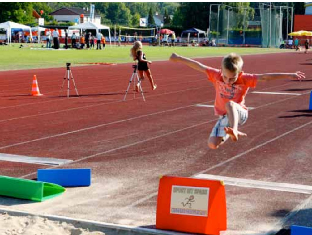
Früh übt, wer einmal ein Profi werden möchte – das Motto „Sport ist Spaß“ war passend für die erste Kindersportmesse in Steyr.

eltern kamen trotz tropischer Temperaturen auf den Sportplatz. Die Kinder konnten bei den aufgebauten Stationen die verschiedenen Sportarten ausprobieren, die die Steyrer Vereine anbieten. Eine Wiederholung im kommenden Jahr ist geplant.