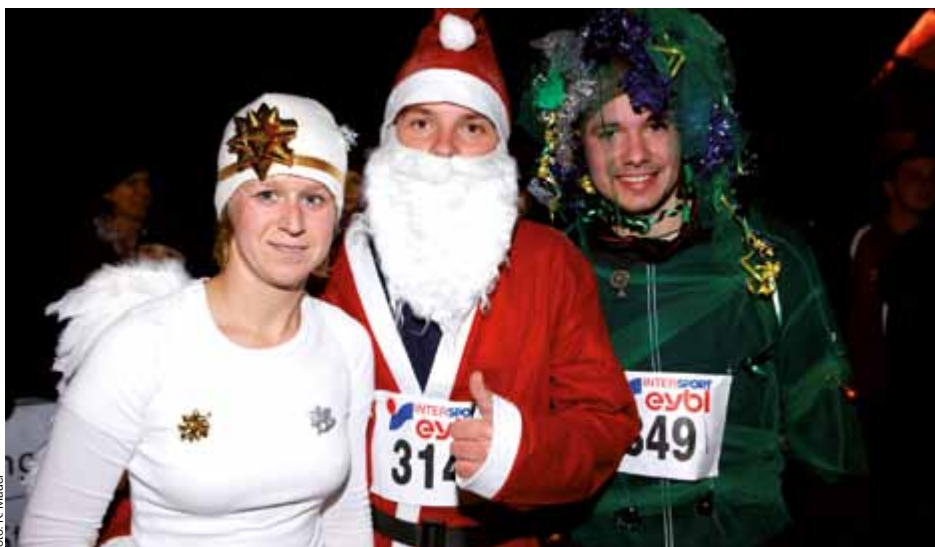
Auch zahlreiche kostümierte Sportler nahmen beim Christkindllauf teil. Das originellste Kostüm wurde prämiert. Sieger wurde der „Christbaum“ rechts im Bild.

Dass der Christkindllauf von Jahr zu Jahr mehr Teilnehmer nach Steyr lockt, hängt auch vom einmaligen Ambiente ab. Der von Scheinwerfern hell erleuchtete Schlosspark ist nur einer der vielen beeindruckenden Streckenschnitte dieses Laufes. Jedes Jahr gehen im-