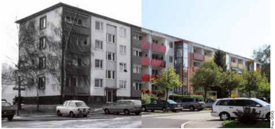
Die GWG der Stadt Steyr feierte heuer ihr 60-Jahr-Jubiläum. 6600 Wohnungen hat die Gemeinnützige Wohnungsgesellschaft bis heute errichtet – das Foto zeigt die Häuser Steinbrecherring 11/13/15 früher und heute.