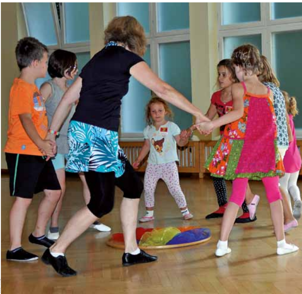
Die Volkshochschule der Stadt Steyr bietet auch im Frühjahr wieder Kurse für alle Altersgruppen an. Viel Spaß haben die Kinder bei den Tanzkursen.