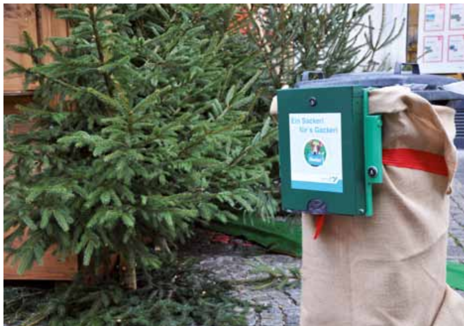
In der Advent- und Weihnachtszeit werden beim Adventmarkt auf dem Stadtplatz Sackerlspender für den Hundekot aufgestellt.