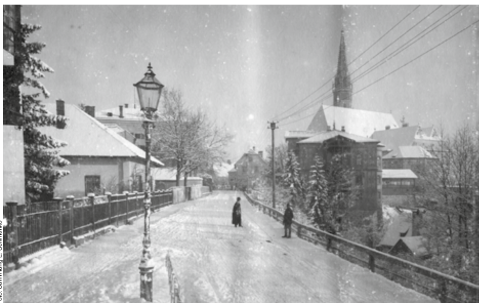
Das um 1904 entstandene Foto zeigt die Leopold-Werndl-Straße. Heute befindet sich hier die City-Point-Kreuzung. Rechts vorne sieht man den Hundstgraben, dahinter die 1867 erbaute Villa Almeroth. Der einstige Besitzer, Carl Almeroth, hat im Innerberger Stadl – dem heutigen Stadtmuseum – einen Eisenhandel betrieben. Später wurde die Villa nach dem neuen Besitzer Hack-Villa genannt.