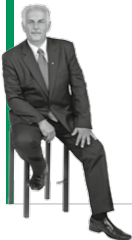
Vizebürgermeister Wilhelm Hauser

Vizebürgermeister Wilhelm Hauser (SP) ist im Stadtssenat für die Freiwillige Feuerwehr, die kommunalen Betriebe Steyr (KBS), den Umweltschutz, den Versorgungsbetriebeverbund und den Wasserverband „Region Steyr“ sowie die Mülldeponie verantwortlich und Aufsichtsrats-Vorsitzender der Stadtbetriebe Steyr GmbH (SBS). Im folgenden Beitrag berichtet er über Neuigkeiten aus seinen Ressorts: