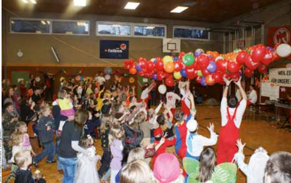
Der alljährliche Kinderfasching in der Mehrzweckhalle Wehrgraben findet heuer am 19. Jänner statt. Beginn ist um 14 Uhr.