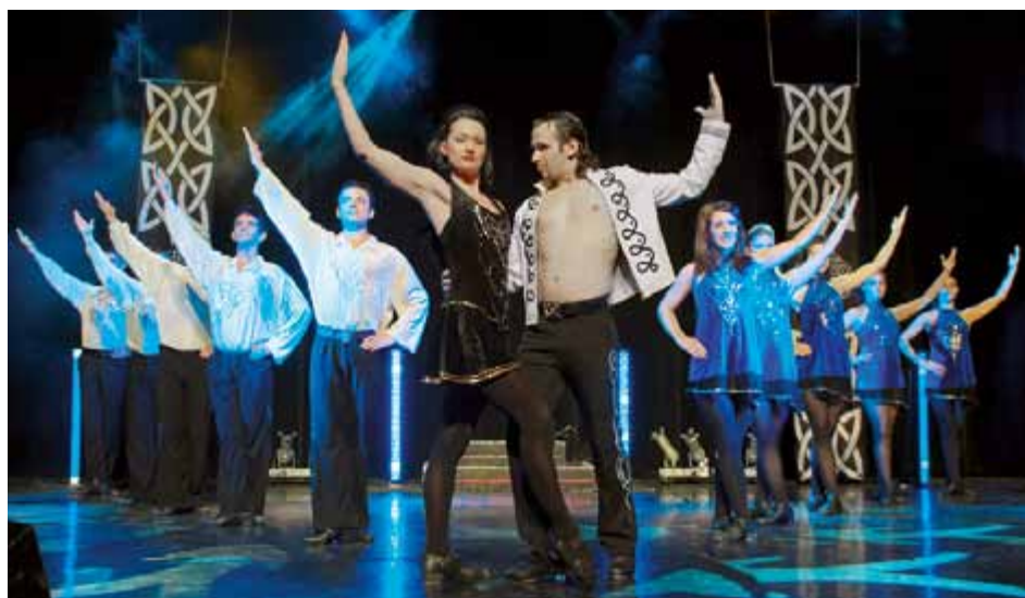
20 internationale Spitzentänzer und Akrobaten präsentieren am 3. Jänner im Stadttheater ihre neue Produktion „Flow“ mit Szenen aus bekannten Musicals und Aufführungen wie z. B. Lord of the Dance.