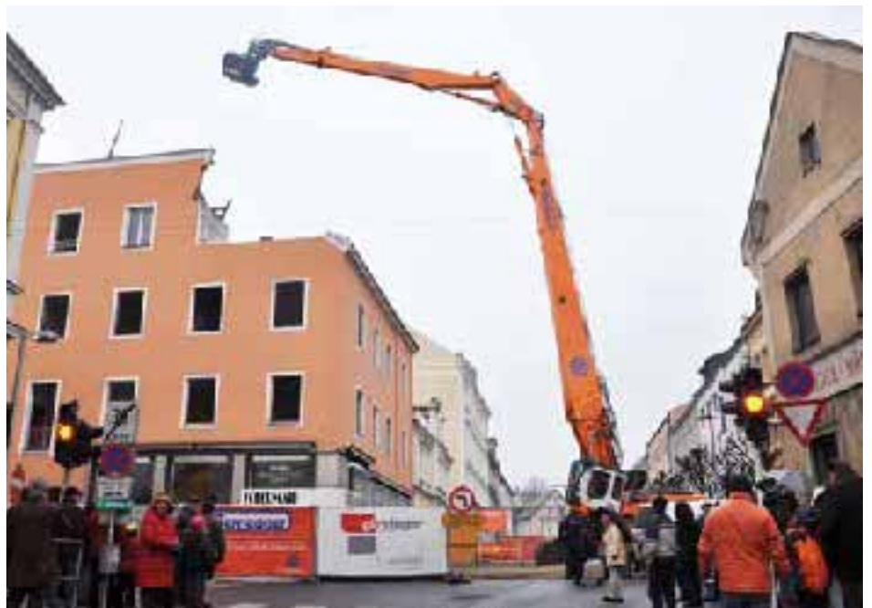
Für den Abbruch des Hauses Pachergasse 2 (ehem. Schuhhaus Fördermayr) wurde der derzeit größte Bagger Österreichs nach Steyr gebracht.