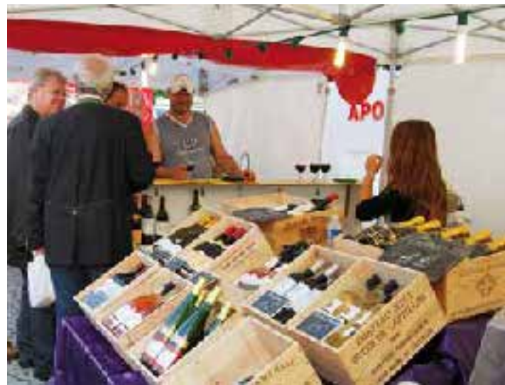
Neben den Wochenmärkten in den verschiedenen Stadtteilen wird es heuer auch wieder einen französischen Spezialitätenmarkt geben.

Ich darf Ihnen versichern, dass ich im Rahmen meiner Möglichkeiten bemüht sein werde, die mir übertragenen Aufgaben zur Zufriedenheit der Steyrer Bevölkerung wahrzunehmen.