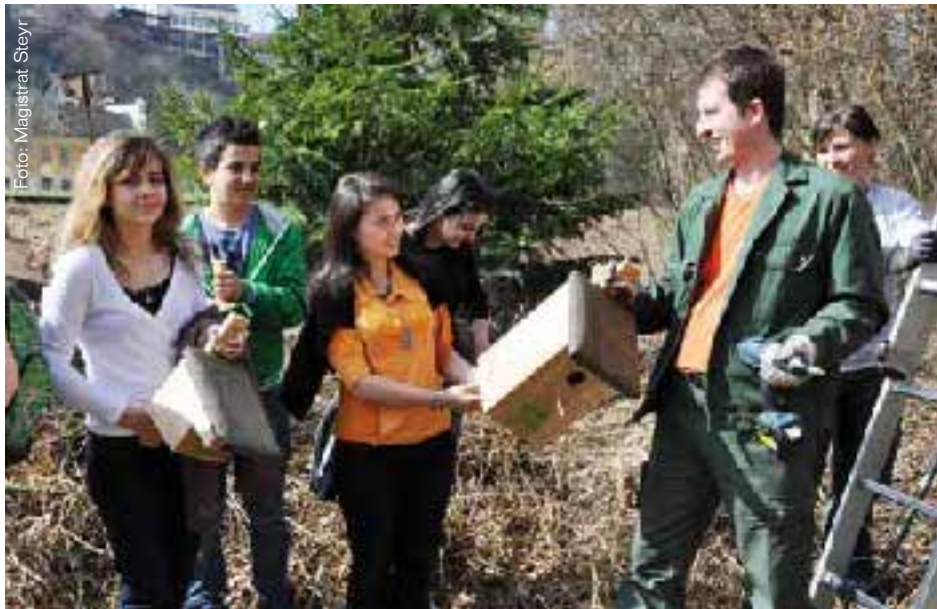
Schülerinnen und Schüler der Handelsschule Steyr halfen mit beim Anbringen der Nistkästen im Bereich der Streuobstwiese in der Unterhimmler Au.