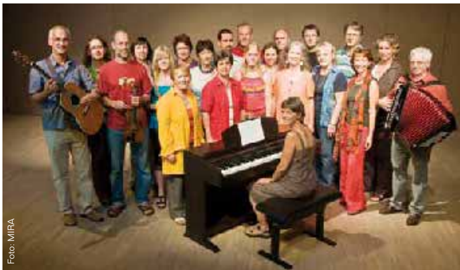
Ein Konzert mit dem 25-köpfigen Vokalensemble MIRA bildet den Abschluss der Aktionen zum „Tag der Arbeitslosen“ am Do, 29. April, um 19 Uhr.

D er Verein Werndl-Pass Steyr als Hauptmitwirkender des „Steyrer Perchtenlaufs“ sucht Mitglieder und freiwillige Helfer, die Spaß und Freude am Brauchtumserhalt der Perchten und Krampusse haben. Kontakt: Reinhard Garstener, Tel. 0676/4533901 oder E-Mail: werndl-pass@hotmail.com. Infos auf www.buero-shop.at/garstener .