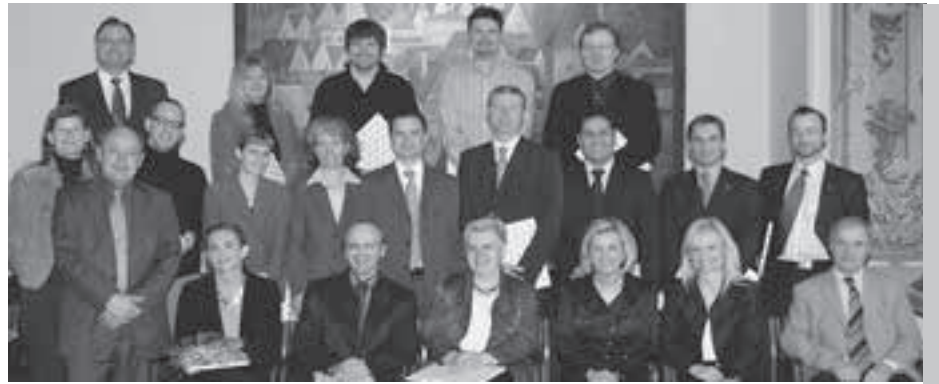
Ein Team, das sich bei einem Seminar für Führungskräfte formiert hatte, entwickelte gemeinsam mit Fachleuten der Stadt Steyr das Projekt Tageswohnen für Kinder. Das Foto ist bei der Präsentation des Projektes im Festsaal des Steyrer Rathauses entstanden.

Bei der Präsentation des Projektes im Festsaal des Steyrer Rathauses dankte Sozialreferent