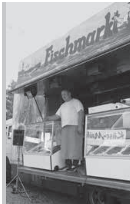
Der Hamburger Fischmarkt (26. bis 28. September) ist nur einer der Sondermärkte, die dieses Jahr auf dem Wieserfeldplatz stattfinden werden. Auch bei der Thüringer Woche (20. bis 22. Juni) und dem Weinmarkt (11. bis 13. September) wird den Besucherinnen und Besuchern Interessantes geboten.

Märkte haben in Steyr schon immer eine große Rolle gespielt und sind immer noch wichtig für die Bewohnerinnen und Bewohner. Über die Märkte in verschiedenen Steyrer Stadtteilen, die eine große Vielfalt an Waren in hoher Qualität anbieten, möchte ich Sie gerne informieren: