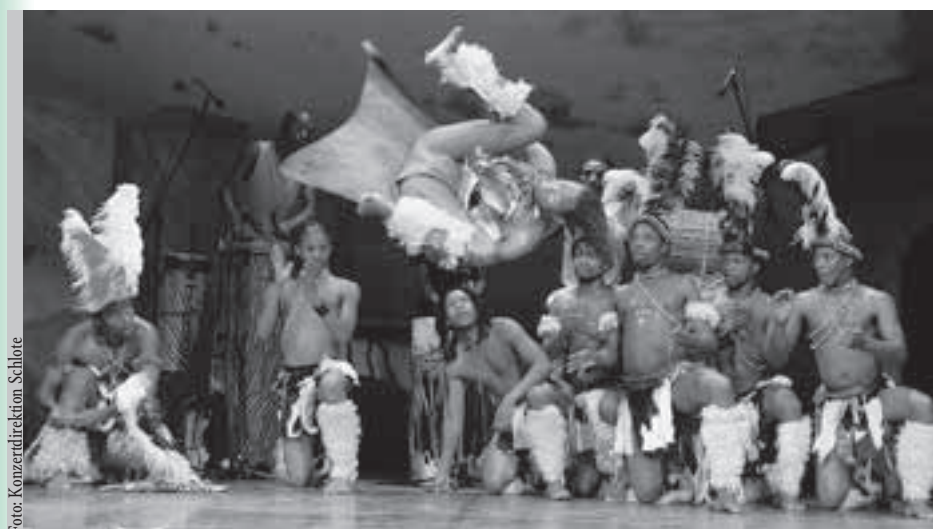
Temperament und Dynamik, Körperbeherrschung und Musikalität, das sind die Zutaten für das Programm „Power of Afrika“ der South African Musical Group am Do, 28. Februar, um 19.30 Uhr im Steyrer Stadttheater.

Anlässlich des Geburtstages von Josef Werndl