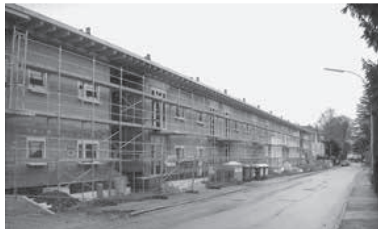
In der Stelzhamerstraße wird zurzeit ein Wohnhaus errichtet, in dem neben 13 Mietwohnungen auch Wohnungen für Menschen mit körperlicher Behinderung geschaffen werden.