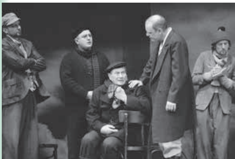
Theodor Storms Novelle „Der Schimmelreiter“ steht am Do, 29. November, im Stadttheater auf dem Programm. Beginn ist um 19.30 Uhr.

Mit ihrer Ausstellung möchte die ARGE „Jugend