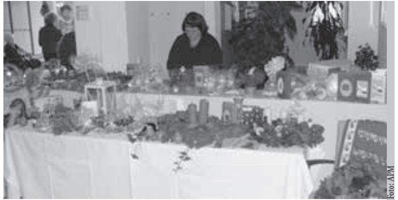
Am 29. November findet von 15 bis 20 Uhr der bereits traditionelle Adventmarkt im Alten- und Pflegeheim Münchenholz statt. Allerlei Weihnachtliches wird angeboten, für das leibliche Wohl wird ebenfalls gesorgt.

einen gemütlichen Nachmittag und Abend zu verbringen.