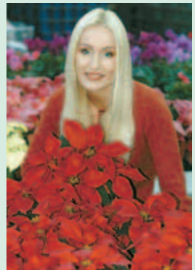
Die Stars zur Advent- und Weihnachtszeit: Weihnachtssterne in vielen Farben und Formen.

Pflege: Sparsam mit zimmerwarmen Wasser gießen. Staunässe vermeiden! Anstatt zu gießen, den Wurzelballen besser 1 Mal pro Woche in Wasser tauchen, bis keine Luftblasen mehr aufsteigen. Abtropfen lassen und in den Übertopf zurück stellen.