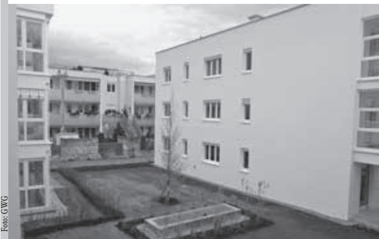
Der letzte Bauabschnitt auf den Knoglergründen ist fertig gestellt. Mitte Oktober fand die Wohnungsübergabe der Häuser Franz-Dworschak-Straße Nr. 6 bis 14 statt.

In diesem Sinne wünsche ich Ihnen ein erfolgreiches Jahr 2008.