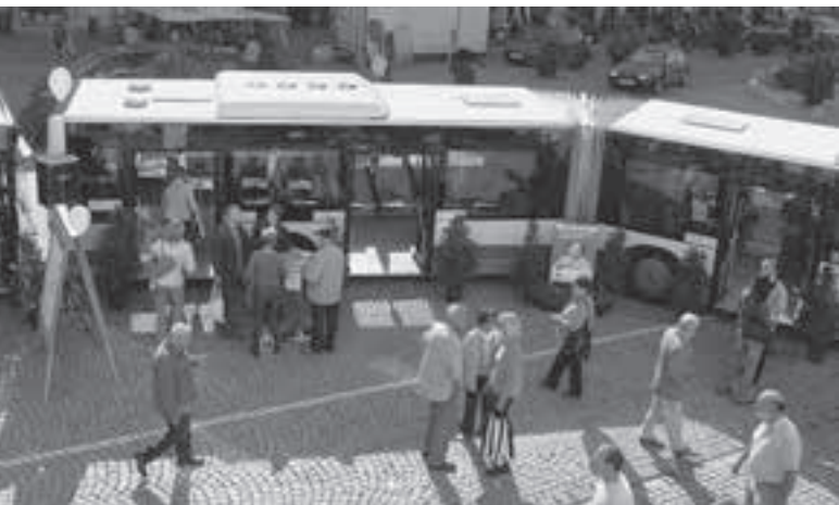
Ende September fand in Steyr der Mobilitätstag statt. Zahlreiche Besucher informierten sich vor Ort u. a. über den Stadtbus.