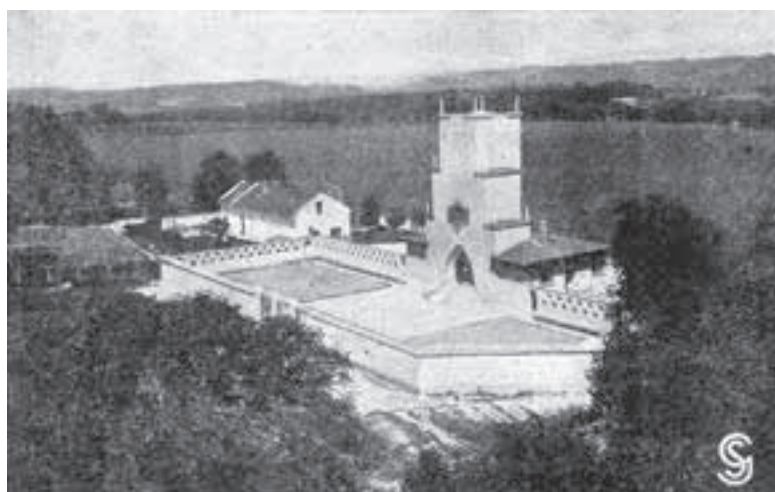
Die Karte zeigt die Feuerhalle auf dem Steyrer Friedhof um 1930. Erbaut wurde sie vom Verein „Die Flamme“, die Eröffnung fand am 26. Juni 1927 statt.