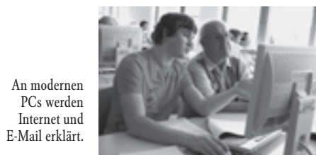
An modernen PCs werden Internet und E-Mail erklärt.

formationen zu finden. Die angehenden Ingenieure sind daher kompetente Ansprechpartner im Umgang mit diesem Medium. Anmeldung im Sekretariat der HTL-Steyr unter der Steyrer Telefonnummer 7291 4.