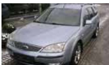
Ford Mondeo Trend Automatik 2,0 TDCI, BJ 11/03, 130 PS, 52.000 km, Kombi, blau-met , Anhängerk, Temp, Radio-CD, Xenon, ABS, NSW 06198 € 16.900,-