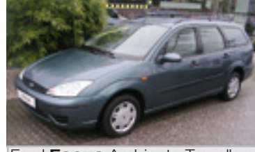
Ford Focus Ambiente Traveller 1,8 TDDI , BJ 9/02 , 90 PS, 64.500 km, grün-met, ABS, Klima, get.Scheiben 06058 € 11.400,-