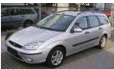
Ford Focus Trend 1,8 TDCI , BJ 8/03, 100 PS, 54.040 km, Kombi, silber-met, Alu, CD-Radio Klima, NSW, ABS, get. Scheiben, 07019 € 12.900,-