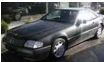
Mercedes SL320 3,2 D, BJ 10/93 231 PS, 131.535 km, 2 trg., schwarz-met , Klima, ABS, Alu, NSW, 07015 € 17.900,-