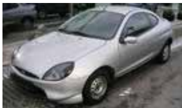
Ford Puma 1,7, BJ 1/99, 125 PS, 69.200 km, 3 trg., silber-met , ABS, Alu, get. Scheiben, ASR, ZV 06200 € 5.500,-