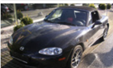
Mazda MX-5 Open Air 1,6, BJ 3/04, 110 PS, 14.099 km, schwarz-met, ABS, LWR, Alu, Windschott, get. Scheiben 07014 € 14.990,-