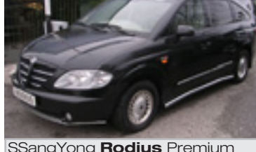
SSangYong Rodius Premium Autom 2,7 TD, BJ 11/05, 165 PS, 16.000 km, 5 trg., schwarz-met, NAVI, Standh, Chromrohrsatz 06035 € 34.900,-