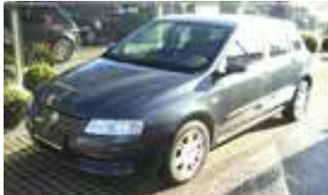
Fiat Stilo Dynamic 1,9 JTD, BJ 4/02 116 PS, 64.382 km, 5 trg., grau-met, Klima, Alu, ABS, NSW, Radio-CD,ESP 07013 € 9.990,-