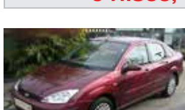
Ford Focus Ghia 1,8 TD, BJ 5/04, 90 PS, 19.000 km, 4-trg rot-met 05128 € 13.990,-