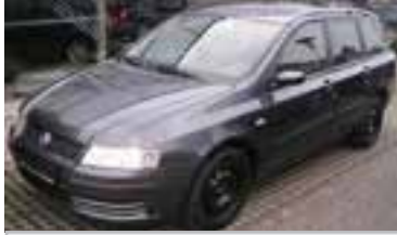
Fiat Stilo Multiwagon Dynamic 1,9 JTD, BJ 8/04, 116 PS, Kombi, 35.000 km, grau-met , NAVI m. Farbm., Klima, Alu, Radio-CD, NSW, ABS, Tempomat 06197 € 14.900,-