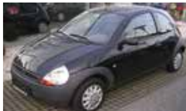
Ford Ka Kipling Edition 1,3, BJ 10/98 , 60 PS, 92.600 km, schwarz-met, Klima, 07021 € 4.200,-