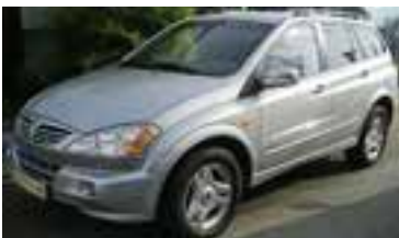
SSangYong Kyron Premium 2,0 XDI, BJ 11/05, 141 PS, 10.525 km, 5 trg., finesilver-met, 06037 € 26.500,-