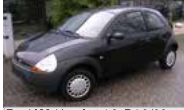
Ford KA Komfort 1,3, BJ 3/03 , 60 PS, 27.000 km, 3 trg., schwarz-met 05163 € 7.800,-