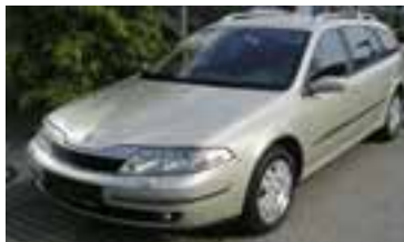
Renault Laguna II Grandtour Privilege 1,9 DCI , BJ 12/03 , 120 PS, 176.000 km, Kombi, hell- grün-met, Klima, NSW, ABS, Alu, Xenon, ESP 07025 € 9.990,-