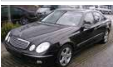
Mercedes E400 Elegance Aut. 4,0 CDI, BJ 2/04, 260 PS, 80.306 km, 4 trg., schwarz-met, Klima, Alu, Leder, Xenon, ABS, NSW, LWR 07018 € 44.900,-