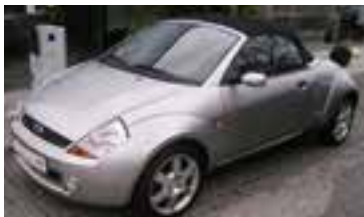
Ford Street KA 1,6, BJ 4/03 , 95 PS, 27.400 km, 2 trg., silber- met, Leder, Klima, el. FH, NSW, FF, LM 16" 06028 € 11.500,-