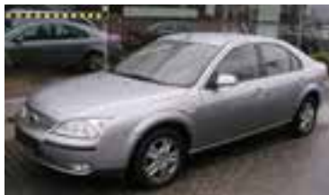
Ford Mondeo Trend 2,0 TDCI , BJ 8/05, 116 PS, 34.818 km, 5 trg., cosmic-silber-met, 06074 € 19.900,-