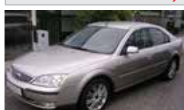
Ford Mondeo Ghia Automatic 2,0 Tdci , BJ 1/04, 130 PS, 53.000 km, 5 trg., sahara.met, 05151 € 18.700,-