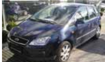
Ford C-Max Trend 1,6 TDCI, BJ 8/05, 109 PS, 32.505 km, 5 trg., blau-met, CD-Radio 06095 € 17.900,-