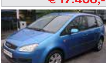
Ford C-Max Trend 1,6 TDCI, BJ 6/05 , 109 PS, 42.950 km, 5 trg., bahama-blau-met, 06076 € 17.700,-