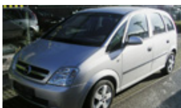
Opel Meriva Enjoy 1,6, BJ 9/03 87 PS, 52.971 km, 5 trg., silber- met , Enjoy MAXX Paket2, Klima. Radio-CD, ABS, Anhängerkupp 07012 € 12.990,-