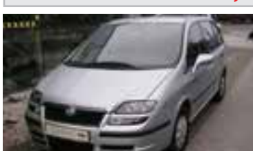
Fiat Ulysse Emotion Pro 2,2 TD BJ 8/03, 128 PS, 43.133 km, 5 trg., silber-met, NSW, PDC, ABS, Radio-CD, Alu, Klima 06182 € 18.900,-