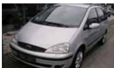
Ford Galaxy Ghia 1,9 TD, BJ 10/03, 130 PS, 85.270 km, sil- ber-met , Klima, get. Scheiben, ,Lederpolsterung,Standheizung 06178 € 19.900,-