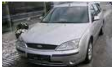
Ford Mondeo Ghia 2,0 TDDI , BJ 6/01 , 116 PS, 155.335 km, Kombi, silber-met , ABS, NSW, CD, Tempomat, Alu 06159 € 10.500,-