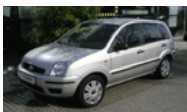
Ford Fusion Trend 1,4 TDCI, BJ 9/05, 68 PS, 23.574 km, 5 trg., silber-met, 06114 € 14.400,-