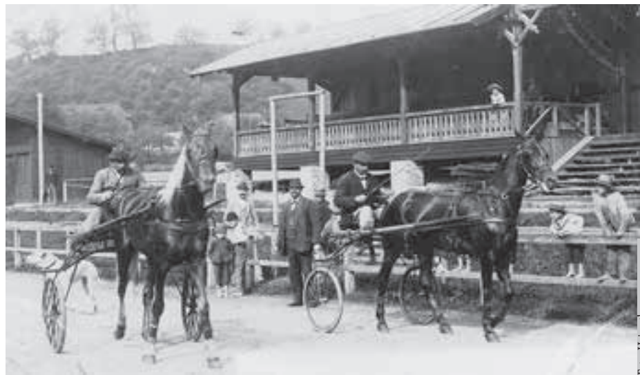
Das Foto zeigt ein Trabrennen im Jahr 1927 auf der Steyrer Rennbahn. Sie hat ihren Namen von der einstigen Pferderenn-Anlage des „Rennvereins“ (gegründet 1894) und wurde am 15. August 1898 eröffnet. Ab 1914 gab es keine Pferderennen mehr, da viele Pferde für den Kriegsdienst eingezogen wurden. Erst 1926 fanden wieder Rennen statt. Infolge der wirtschaftlichen Krise fand am 17. August 1930 das letzte Pferderennen auf der 800 Meter langen Bahn statt.

■ Der Wehrgraben, dessen Zuschüttung im Rathaus geplant ist, ist zurzeit das große Thema in Steyr. Nunmehr hat sich auch der Präsident des Österreichischen Kunstsenats, Prof. Dr. Roland Rainer, zu Wort gemeldet, um eine Zerstörung des historischen Wasserlaufs als unverantwortbar gegenüber Vergangenheit und Zukunft zu bezeichnen.