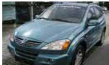
SSangYong Kyron Premium Automatic 2,0 TD , BJ 3/06, 141 PS, 16.162 km, 5 trg., paradis blue , 06148 € 29.900,-