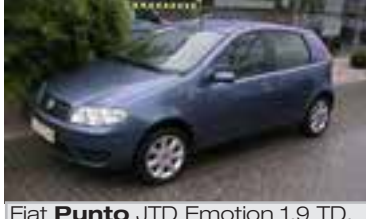
Fiat Punto JTD Emotion 1,9 TD, BJ 6/04, 86 PS, 44.000 km, 5 trg., blau-met, LM, Radio-CD, Klima, Nebelscheinwerfer, ABS, EDS, Bordcomputer 06065 € 10.900,-