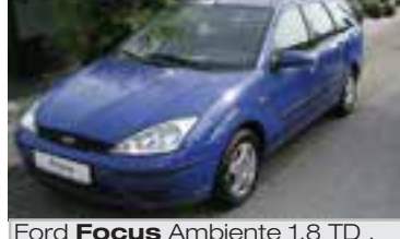
Ford Focus Ambiente 1,8 TD , BJ 3/02, 90 PS, 62.500 km, Kombi, blau, Klima, get. Scheiben, el Fenterheber, 06025 € 10.500,-