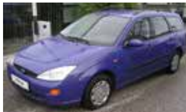
Ford Focus Trend 1,8 TD, BJ 6/00, 90 PS, 146.000 km, Kombi, blau , Klima, 05079 € 7.700,-