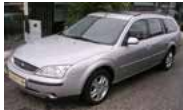
Ford Mondeo Ghia Executiv 2,0 Tdci , BJ 4/02 , 130 PS, 83.000 km, Kombi, kristallsilber- met., Teleforb., 05152 € 15.900,-