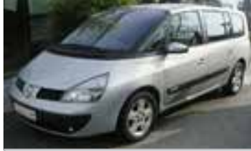
Renault Grand Espace 3,0 DCI, BJ 11/02, 177 PS, 104.517 km, 5 trg., silber-met, Standh., NSW, Klima, LWR, Tempomat, ABS 06126 € 21.900,-