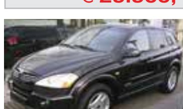
SSangYong Kyron Premium Autom. 2,0 XDI, BJ 5/06, 141 PS, 15.900 km, 5 trg., schwarz-met, Klima, ABS, LWR, NSW, CD, MP3, Bremsass. 07006 € 29.900,-