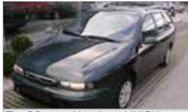
Fiat Marea Weekend 75SX 1,9 TD, BJ 9/99, 75 PS, 5 trg., 95.701 km, grün-met, ABS, LWR, ZV, get. Scheiben 6174 € 4.990,-