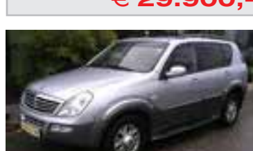
SSangYong Rexton Premium 2,7 TD, BJ 6/05, 163 PS, 5 trg. 6.500 km, finesilver-met, 05169 € 28.900,-