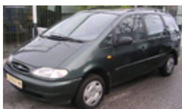
Ford Galaxy GLX 1,9 TD, BJ 10/97, 90 PS, 114.547 km, grün-met , Dachreling, NSW 06083 € 8.200,-