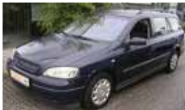
Opel Astra Caravan 1,7 D, BJ 4/01 , 75 PS, 101.580 km, 5 trg., blau, Klima, Alu 05175 € 7.990,-