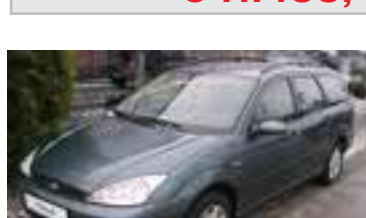
Ford Focus Ambiente Traveller 1,8 TD, BJ 3/03, 90 PS, 95.926 km neptungrün-met., 3N052 € 11.500,-