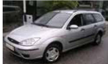
Ford Focus Ambiente 1,8 TD , BJ 4/02, 90 PS, 154.000 km, Kombi, silber-met, Winterpaket, 05062 € 8.500,-