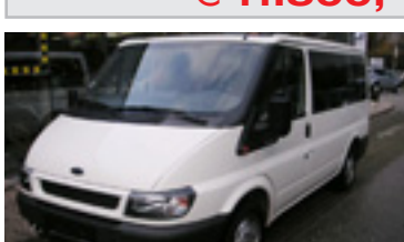
Ford Transit 280K Vario-Bus 2,0 Tdi , BJ 12/05, 100 PS, 24.096 km, 4 trg., diamant- weiss , EDS, 06156 € 23.900,-