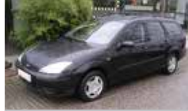
Ford Focus Ambiente Traveller 1,8 TDCI, BJ 6/02, 115 PS, Kombi 67.000 km, schwarz-met 05161 € 11.500,-