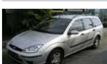
Ford Focus Ambiente 1,8 TD, BJ 9/03, 90 PS, 47.771 km, Kombi, solarsilber-met 3N131 € 12.900,-