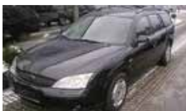
Ford Mondeo Trend 2,0 TDDI , BJ 7/01 , 116 PS, 120.000 km, Kombi, schwarz-met , LWR, NSW, Klima, ABS 06190 € 9.900,-