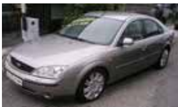
Ford Mondeo Ghia Elance Autom. 2,0 Tdci , BJ 6/03 , 130 PS, 119.924 km, 5 trg., saha- ra-met , ESP, 35%get, Elacepaket, 05131 € 17.500,-