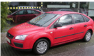
Ford Focus Trend 1,6 TDI , BJ 4/05 , 109 PS, 37.316 km, 5 trg., coloradorot 06052 € 15.400,-