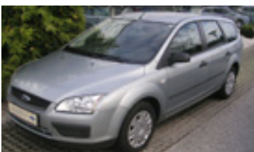
Ford Focus Trend 1,6 TDCI , BJ 8/05, 109 PS, 24.636 km, Kombi, silber-met , 06115 € 16.900,-