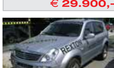
SSangYong Rexton Plus Autom 2,7 Tci, BJ 9/05, 165 PS, 14.000 km 5 trg., finesilver-met , 18" 5N516 € 29.900,-