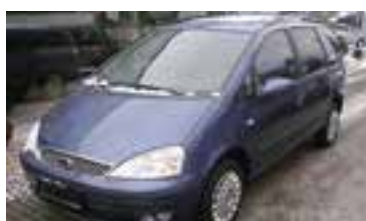
Ford Galaxy Trend 1,9 PD, BJ 10/05 , 116 PS, 41.348 km, jeans-blau-met, 35% get. Scheiben, 7 Sitze 06155 € 23.900,-