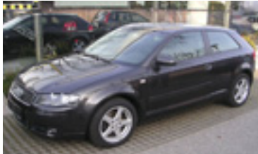
Audi A3 Ambition 1,9 TDI, BJ 4/04, 105 PS, 81.200 km, 3 trg., grau-met, ABS, NSW, ESP, Radio-CD, get.Scheiben 07022 € 15.900,-