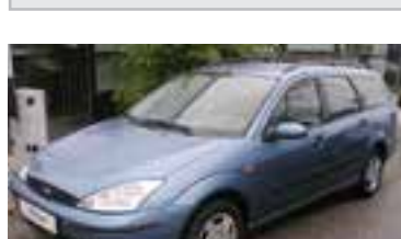
Ford Focus Ambiente 1,8 TD, BJ 4/02, 90 PS, 108.538 km, Kombi, blau-met, Klima 06038 € 9.900,-