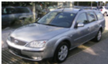
Ford Mondeo Trend 2,0 TDCI , BJ 5/04, 116 PS, 44.250 km, Kombi, silber-met, CD-Radio, Alu, NSW, Klima, Xenon, Bremsassistent 06149 € 17.900,-