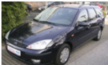
Ford Focus Ghia 1,8 TDDI , BJ 2/04 , 90 PS, 108.190 km, Kombi, blau , Klima, ABS, NSW, ZV, el.FH, 06118 € 9.900,-