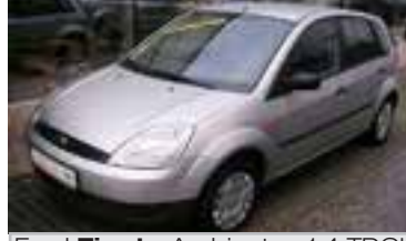
Ford Fiesta Ambiente+ 1,4 TDCI BJ 10/05, 68 PS, 16.577 km, 5 trg., silber-met 06142 € 11.900,-