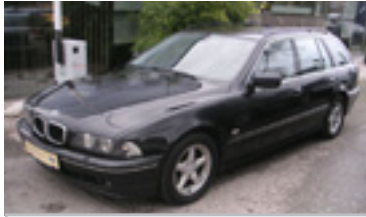
BMW 530d 3,0 TD, BJ 5/02 193 PS, 218.000 km, Kombi, schwarz-met , Hifi, Leder, Sitzheizung vorne, Navi m.TV 05110 € 18.900,-