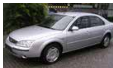
Ford Mondeo Trend 2,0 TCI , BJ 5/02 , 90 PS, 80.000 km, 5 trg., silber-met , LM, CD, Klima. NSW, Alu 17' 05166 € 12.500,-