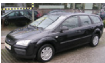
Ford Focus Trend 1,6 TDCI , BJ 9/05, 109 PS, 33.242 km, Kombi, schwarz-met, 06144 € 16.900,-