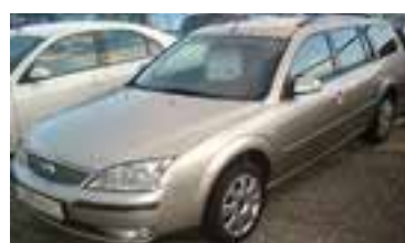
Ford Mondeo Ghia-X 2,0 Tci BJ 5/04, 130 PS, 64.000 km, Kombi, platinum-met , Automatic, 05091 € 20.900,-